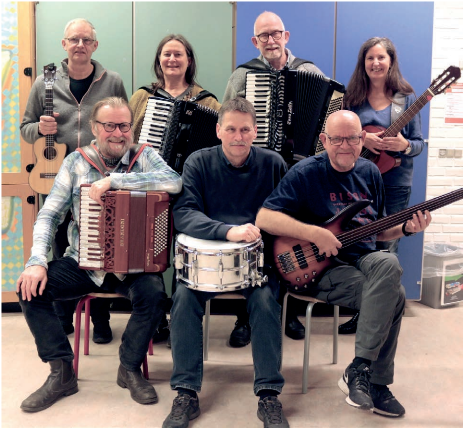
Kielgasterne på Odden den 17. juni.