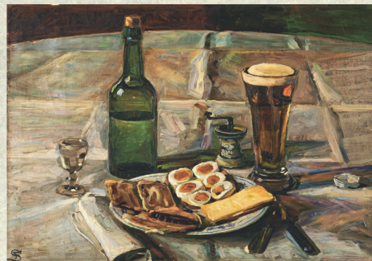
Fritz Syberg, 'Ved Frokosten', 1906