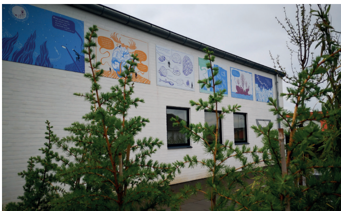
Vægfrisen i den nye have

Indvielsen af haven fandt sted søndag d. 19. september. Forinden havde museets gæster allerede haft glæde af haven som et rekreativt opholdssted og som et museumsrum, der med sin nordiske birkeskov og sin bambus af fjernøstlig oprindelse anslår den kosmopolitiske stemning, som er knyttet sig til Johs. V.'s og Thits forfatter-skaber.