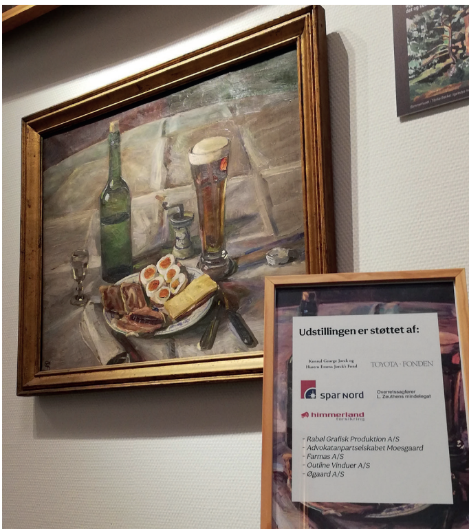
Fritz Syberg "Ved Frokosten", 1906