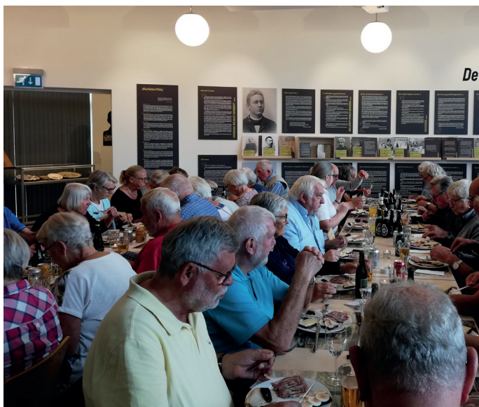
Fuldt hus på museet til en Syberg-frokost

rangementer. Samarbejde med en bred vifte af kulturinstitutioner er en forudsætning for, at vi også i fremtiden kan udvikle museets formidling og skabe spændende arrangementer på et højt kvalitetsniveau.