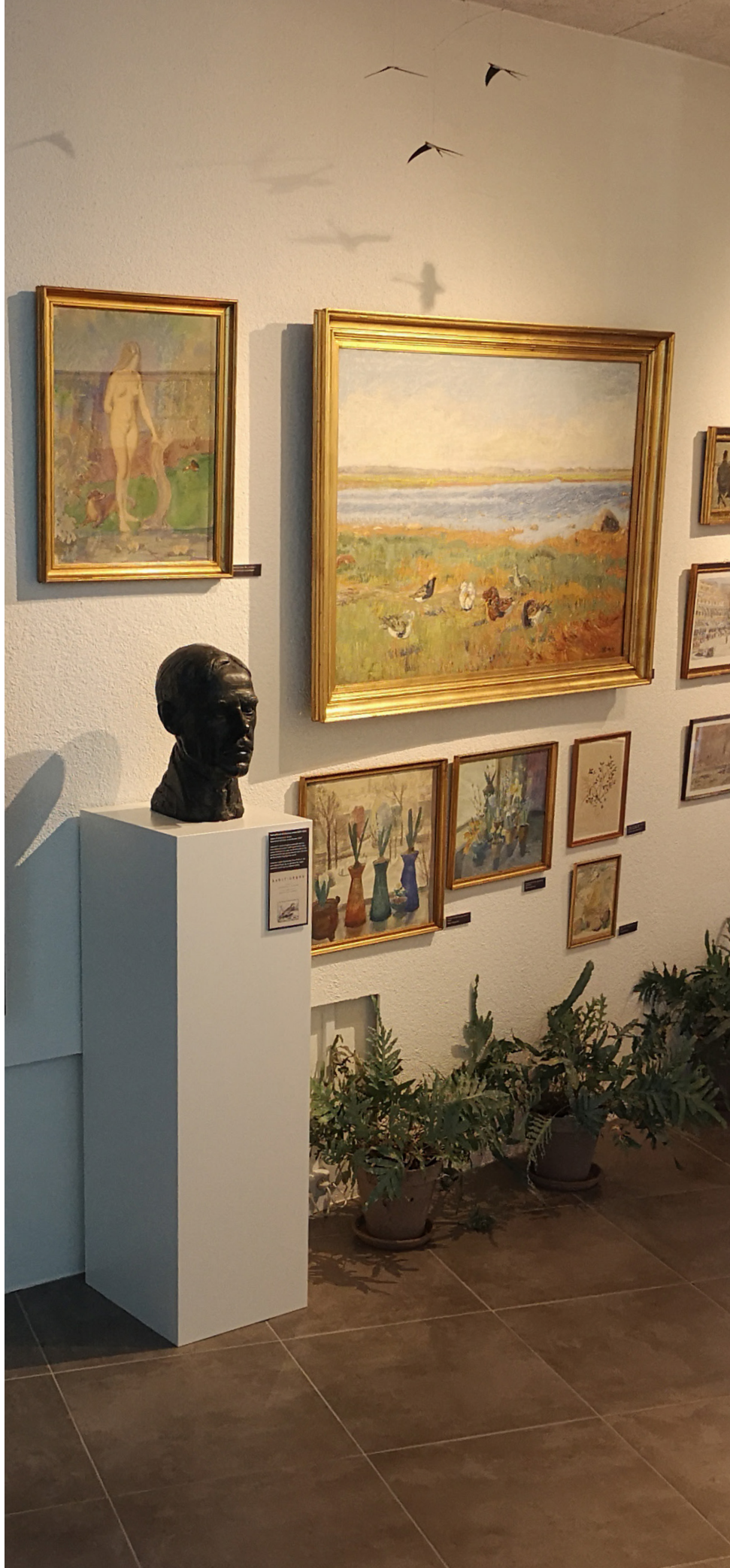
Der er højt til loftet i foyeren, med udstillingen af De Fynske Malere.