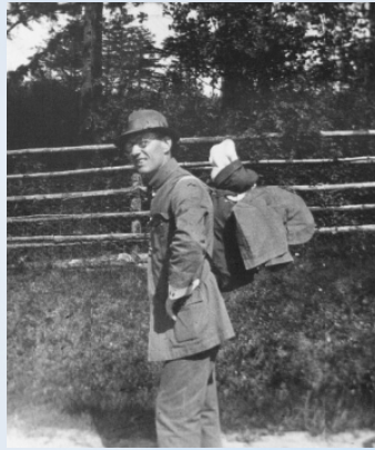
Johs. på vandretur (u.å.)