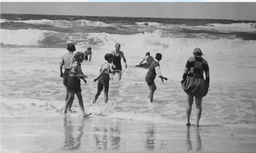
Tibirke ca. 1930