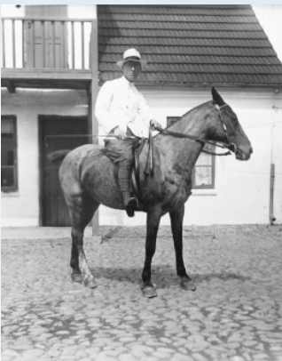
Johs. til hest (1912)