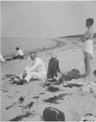
Johs. ved stranden (u.å)