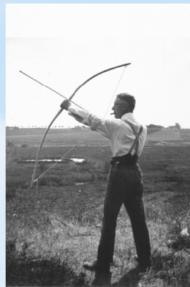
Johs. m. bue og pil (u.å)