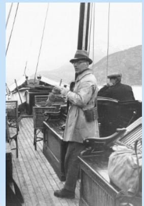
Johs. til søs 1923