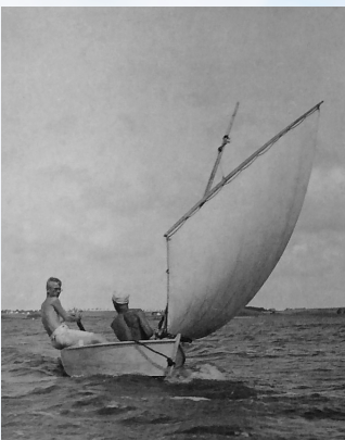
Unge sejlere v. Tibirke (u.å.)