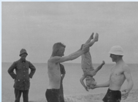
Johs. og sønner v. Tibirke 1925