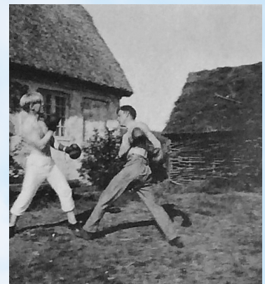
Unge bokserere i Tibirke (u.å.)