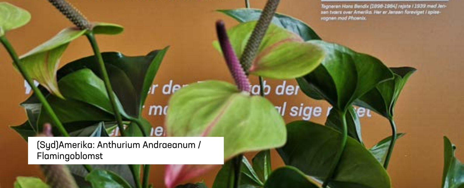
(Syd)Amerika: Anthurium Andraeanum / Flamingoblomst