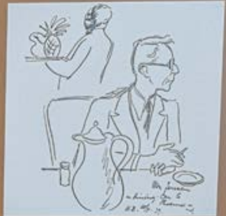
Tegneren Hans Bendix (1898-1984) rejste i 1939 med Jensen tværs over Amerika. Her er Jensen forevigtet i spisevognen mod Phoenix.

I takt med fascismens og kommunismens fremmarch i 1930'erne blev Amerika mere end nogensinde som hjemsted for den personlige frihed og den demokratiske, vellystede demokrati. "Fristaterne - har det nogensinde lyst og glæde, haaber du mere Klang end det gør nu, nu?" spurgte Jensen retorisk i sin samling rejseberetninger Fra Fristaterne , der blev udgivet netop i den skæbnesvangre september måned 1939, med den anden store verdenskrig for døren.