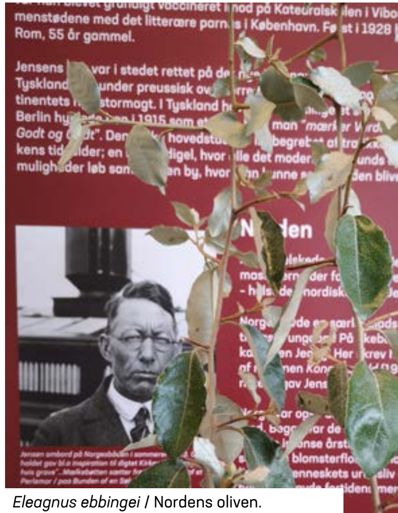
Eleagnus ebbingei / Nordens oliven.