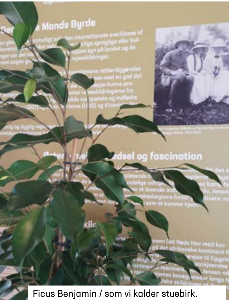
Ficus Benjamin / som vi kalder stuebirk.