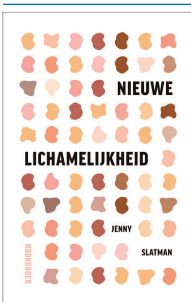
Jenny Slatman, Nieuwe lichamelijkheid . Gorredijk: Noordboek, 2023.

Nieuwe lichamelijkheid is zowel een filosofisch onderzoek naar mens-zijn als een praktisch en concreet pleidooi voor een radicale verandering in de gezondheidszorg. Nieuwe lichamelijkheid is toegankelijk geschreven, maar daarom niet minder diepgaand. Slatman schrijft goed en weet complexe ideeën van onder andere Foucault, Fanon en Merleau-Ponty helder te schetsen, al wordt de stroom van het betoog vaak onderbroken door wéér een nieuwe denker. Haar pleidooi had soms best wat meer op eigen benen mogen staan. De multidisciplinaire en empirische aanpak is vernieuwend voor de filosofie en biedt een ongekend brede kijk op zorg. Dit boek is belangrijk en toegankelijk voor artsen en therapeuten die verder willen kijken dan het cartesians dualisme, en het is tegelijk een warme deken van bevestiging en begrip voor iedereen die zich ooit ongehoord heeft gevoeld door de gezondheidszorg of door de wereld.