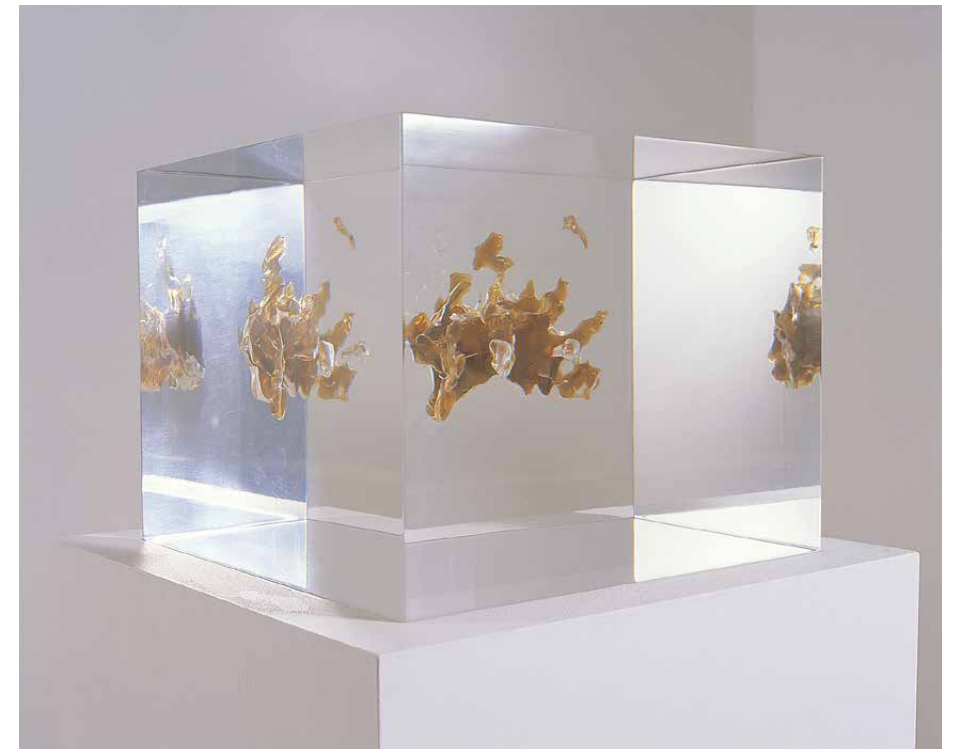
Annie Cattrell, Seeing (2001)

Het werk Sense van Annie Cattrell bestaat uit vijf harssculpturen, welke samen de vijf zintuigen uitbeelden (gemaakt tussen 2001 en 2003). Het gaat om lichtbruine harsvormen die in blokken van doorzichtig hars zitten geklonken. De transparante blokken (25cmx25cmx25cm) staan op sokkels zodat de beelden op ooghoogte staan, en men zich er zelfs een beetje in kan spiegelen. Ook het licht van de omgeving reflecteert erin.