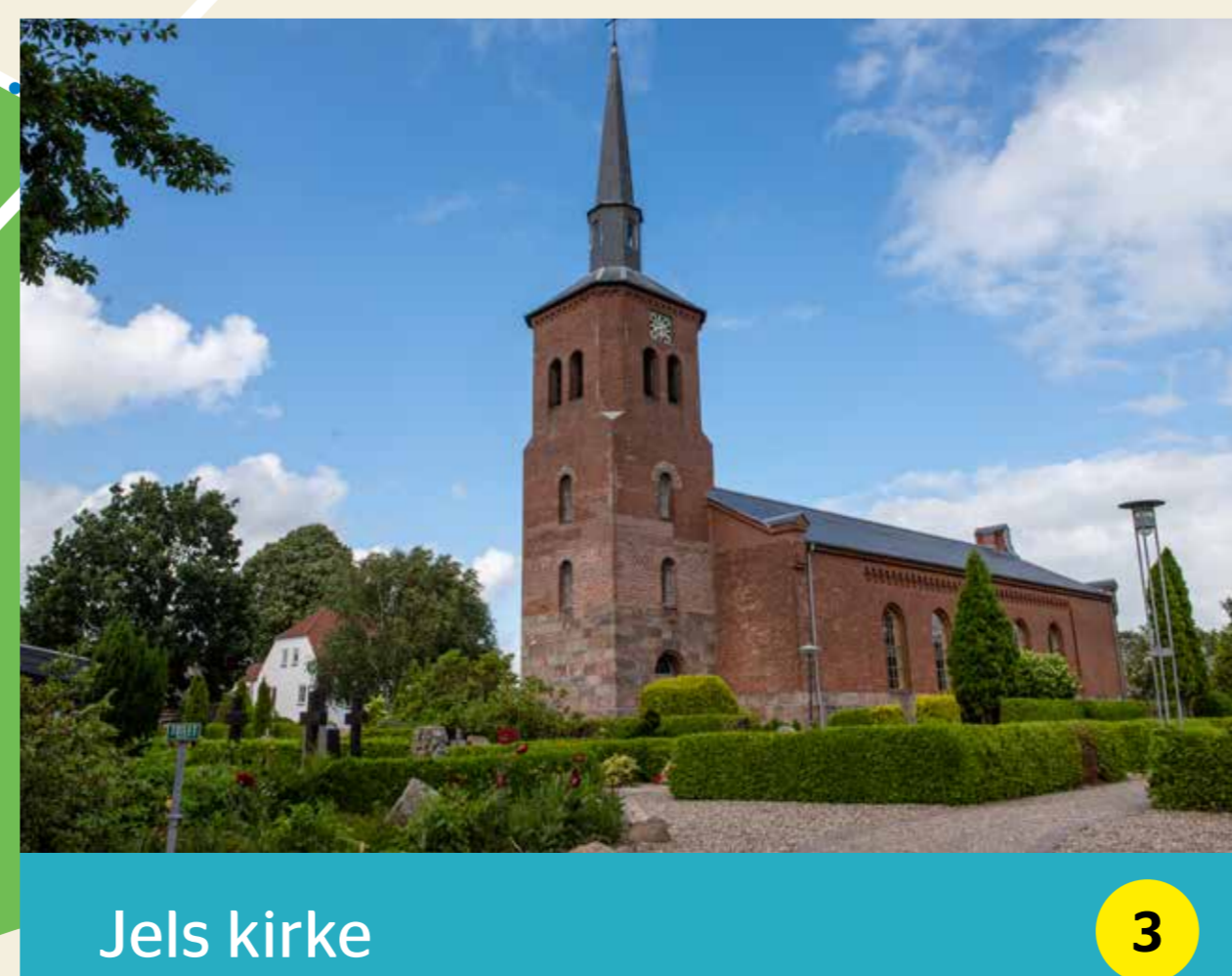
Jels kirke 3