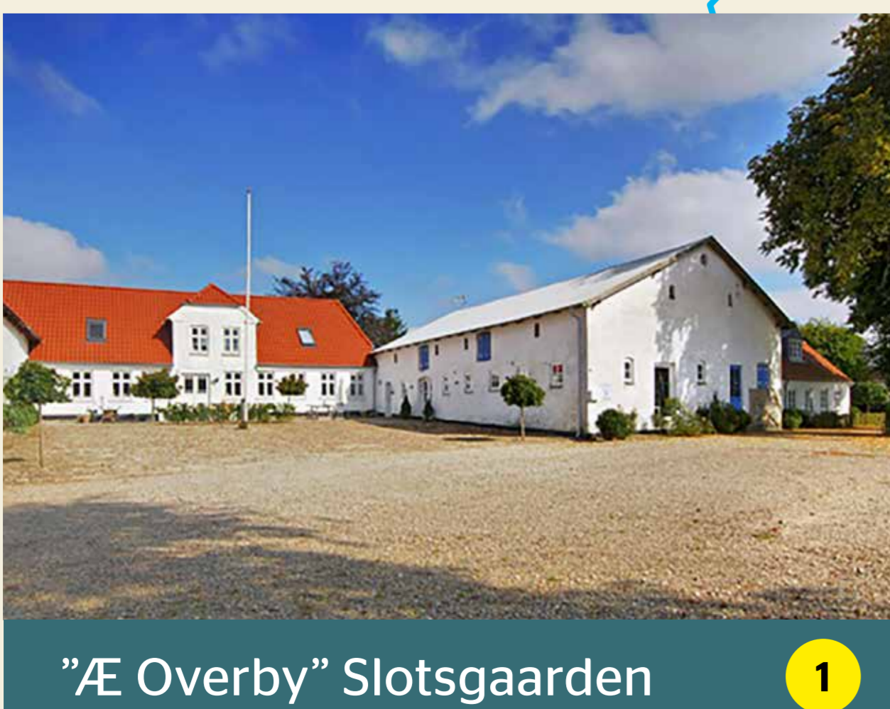
"Æ Overby" Slotsgaarden 1