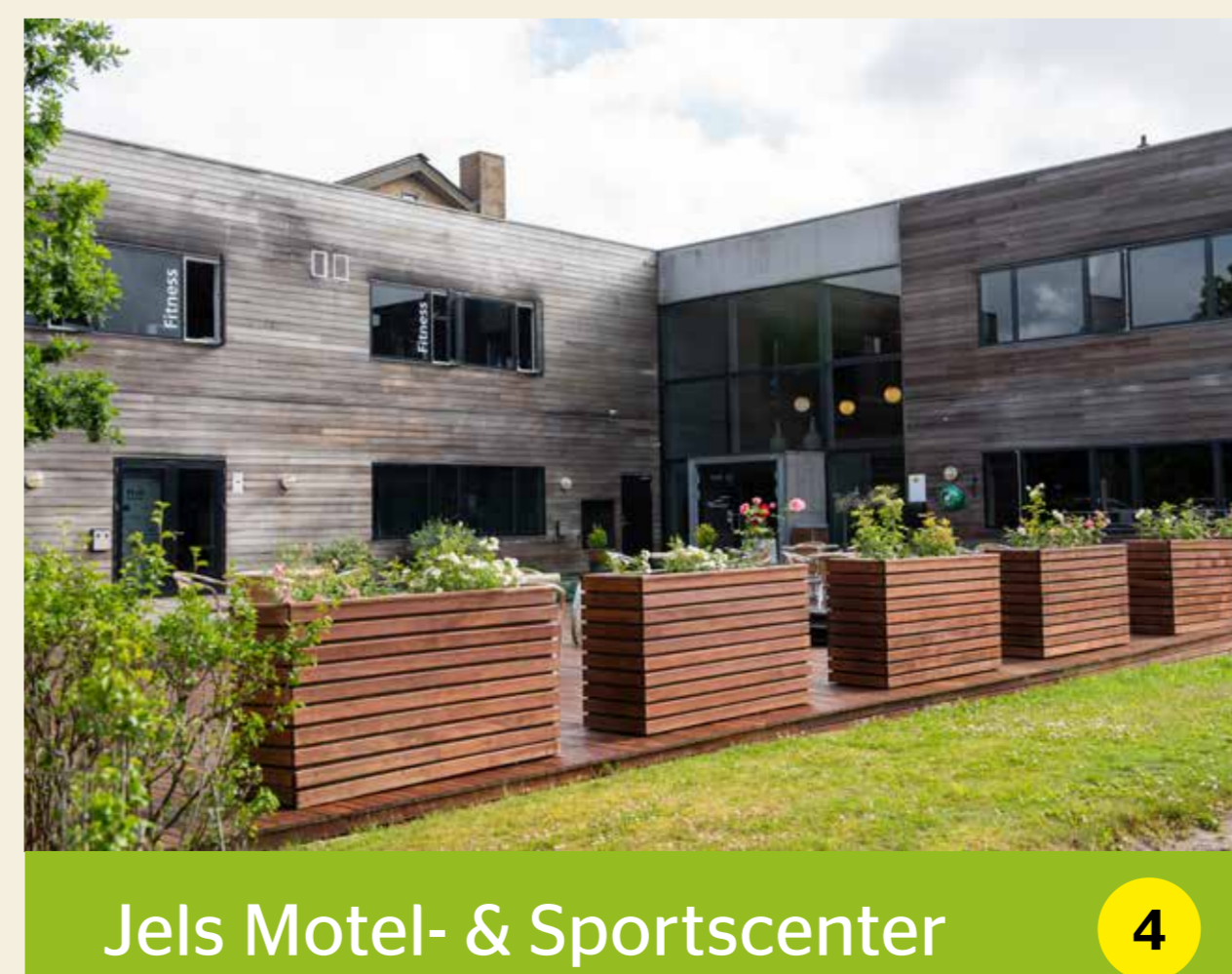
Jels Motel- & Sportscenter 4