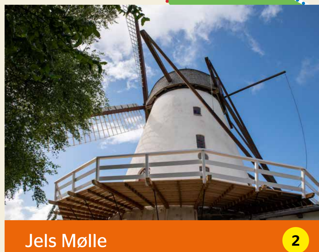
Jels Mølle 2