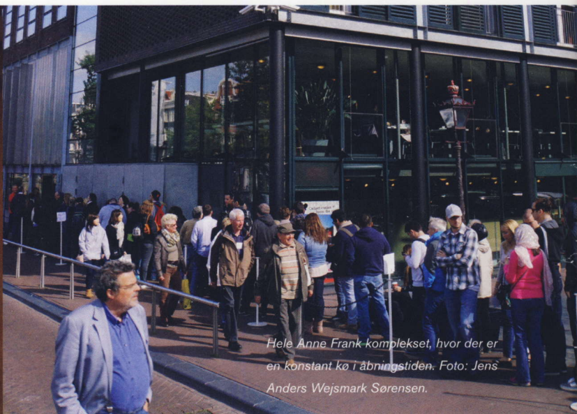
Hele Anne Frank-komplekset, hvor der er en konstant kø i åbningstiden.