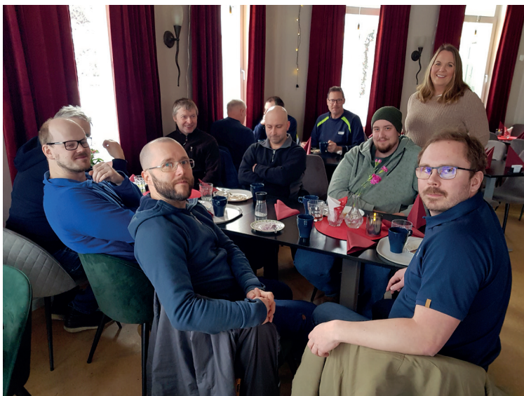
Nöjda lunchgäster, som alla ville vara med på bild!!!

Köpet av Älggårdsberget blev en snabb affär. Tankar hade funnits en tid. Skall ett köp lyck-