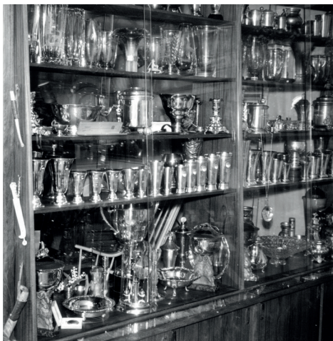
Sixten Jernbergs pokalsamling.