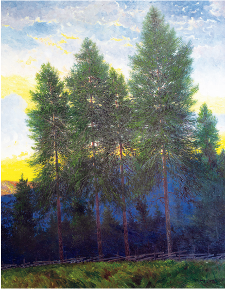
Furor i solnedgång, Liden.

Ingen är kung i sitt eget rike heter det ju och det kom att prägla denne konstnärs framgångar. Lycke kom aldrig att tillhöra de riktigt namnkunniga. Han hade utställningar både i New York och Köpenhamn men det fanns en uppfattning i staden att konstnären inte var helt uppskattad efter förtjänst, något som Sundsvallsposten skrev om efter en utställning av hans konst på hotell Knaust i Sundsvall.