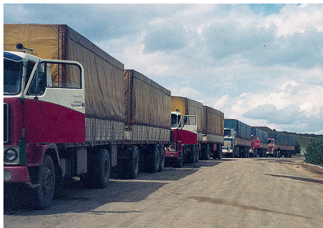
Väntan och åter väntan på lossning vid Volvo-fabriken i Teheran.

Nu börjar de dåliga vägarna märkas. Flera punkteringar. Lättnad efter passagen av den bulgariska gränsen med tanke på den tidigare olyckan med den bulgariska lastbilen. Polis-kontroller igen. Telefonkontakt med Sverige. Allt var bra hemma.