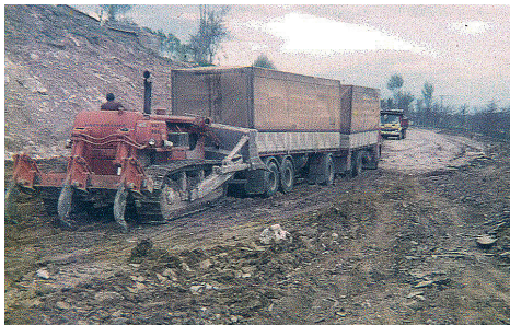
På de dåliga vägarna behövdes ibland hjälp av schaktmaskiner.