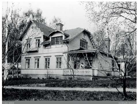
Konstnärens ateljé på Heffnersvägen i Sundsvall

Att det var tuffa villkor i den stora staden fick han snart erfara. Som så många andra inflyttade upplevde han möjligheterna i ett sådant innovationsområde, men också svårigheterna.