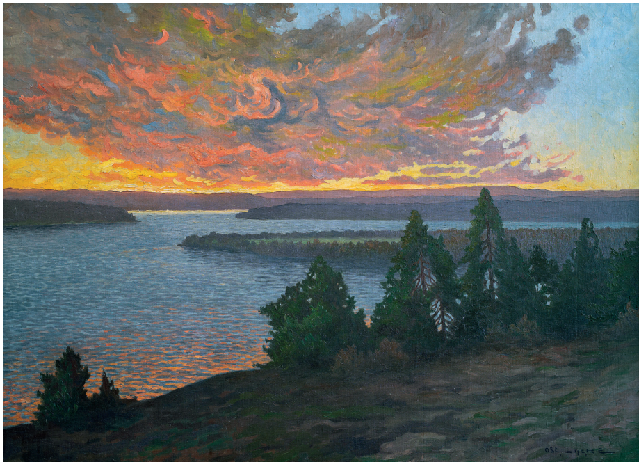
Höstkväll i Hälsingland, ca. 1920 Oskar Lycke Wikimedia Commons public domain.

Han fick ta det som bjöds och livnärde sig, bland annat, på att illustrera olika alster samt att teckna lustigheter i tidens skämttidningar. Tiden var dock på Oskars sida.