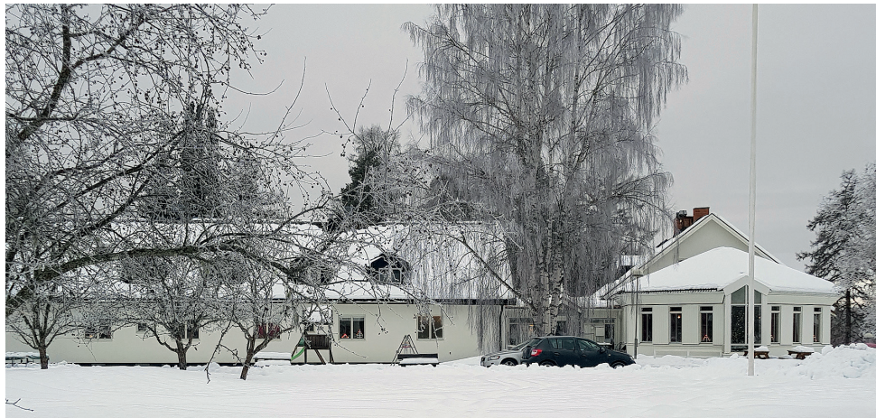
Älggårdsberget, här en liten del av hela anläggningen. Matsalen till höger.