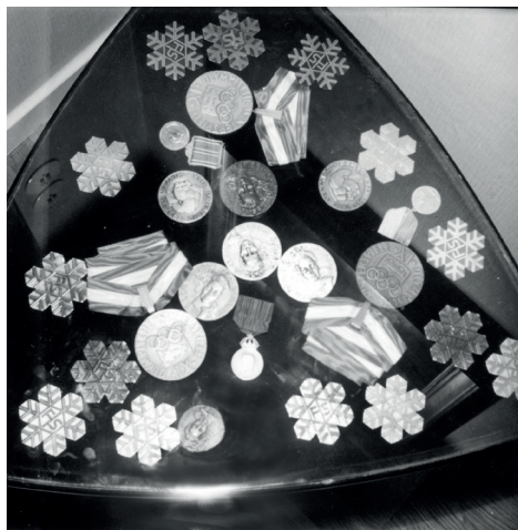
Sixten Jernbergs medaljer i hemmet i Limesforsen.

Sixten Jernbergs storhet låg nog i en hårdhet