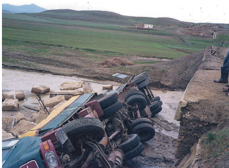
Voltade lastbilar i Turkiet var inte någon ovanlig syn.

mycket snö. Väglutningen kunde vara 10 – 15 %. Vissa arbetsdagar blev 15 timmar långa då chaufförerna inte vågade stanna. De var inte väl sedda eftersom de körde på turkarnas vägar. Regn och snö om vart annat gjorde att vägarna nästan hade spolats bort.