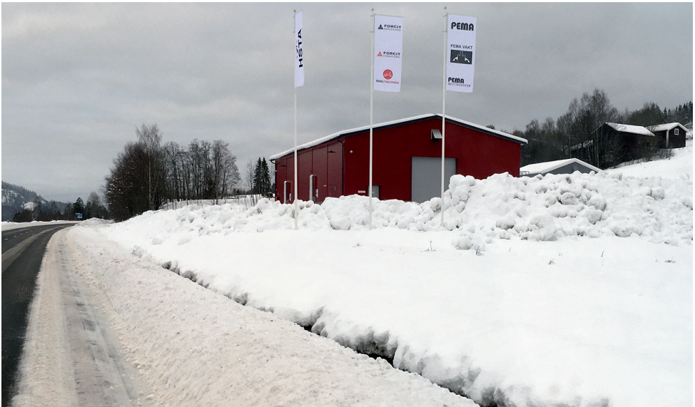
FORCIT:s råvarulager för sprängämnen söder om infarten till Liden.

Mycket riktigt är det något annat, nämligen FORCIT som har uppfört en råvarustation. Här förvaras kemikalier för tillverkning av sprängämnen. Var dock lugn, här finns ingenting som kan explodera, dynamiten är i säkert förvar på annan lokal.