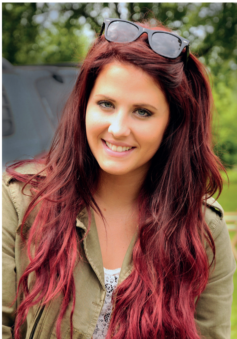
Molly Sandén på Trollnatta 2012.

emangsbidrag samt entréavgifterna betalade artistarvodet, råvarorna samt elströmmen. Alla (30 personer) som hjälpte till vid Trollnatta ställde upp gratis. För att driva caféet under sex veckor behövdes 20–25 personer varje sommar med ideella insatser. Många kända artister har uppträtt under åren. Förutom artistarvodet skulle resor, upphäälle och