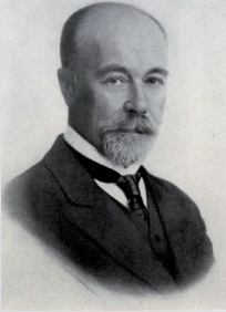
Gerhard de Geer 1858 -1943.

Ragundadalen har haft stor betydelse för dateringen av den senaste istidens slut. Omkring 1840 lanserades den för tiden kontroversiella teorin att norra halvklotet hade varit täckt av en tjock inlandsis. År 1856 upptäckte svensken Hampus von Post, som bland annat var verksam vid det som nu är Sveriges lantbruksumiversitet, SLU, att en del leror bestod av växlande varv av lera och silt. År 1884 fastslog Geologen Gerard de Geer att lervarven var årsavlagringar som bildades under vårfloden vid inlandsisens avsmältning. de Geer utvecklade en