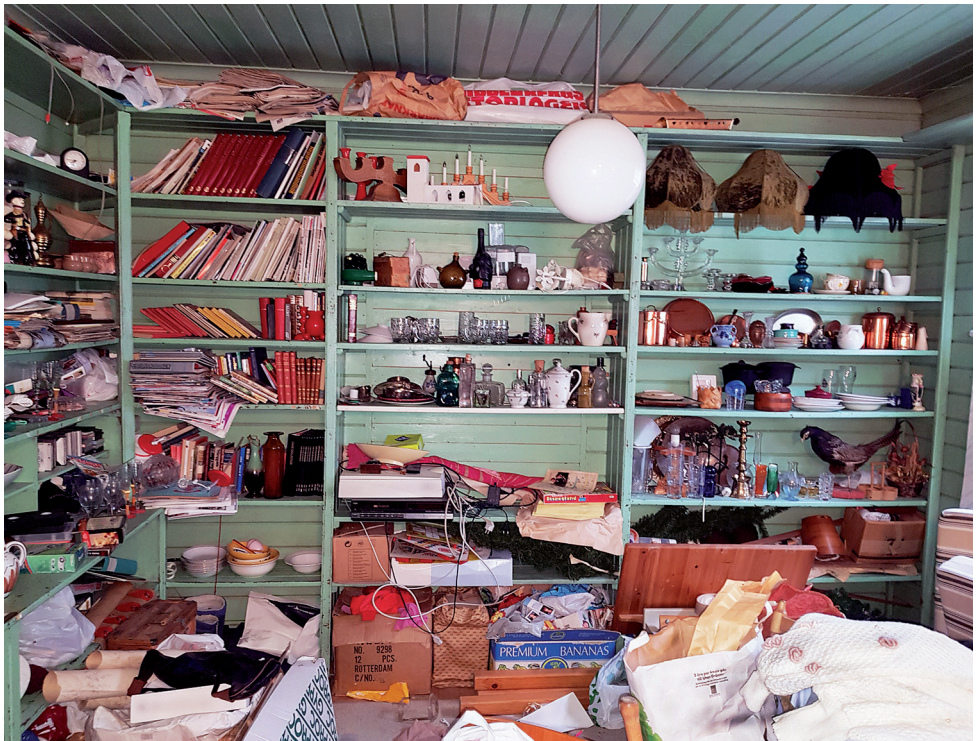
Lanthandelns originalinredning finns kvar och är en perfekt förvaringsplats för alla möjliga prylar.