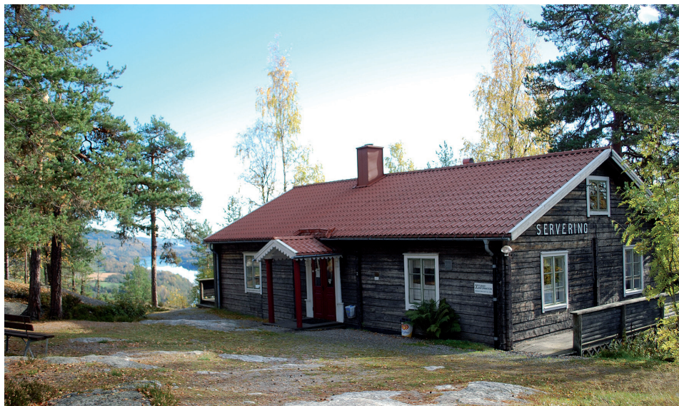
Lidens Hembygdsgårdens hembygdsgård på Vättaberget, uppförd vid mitten av 1950-talet. Utsikten härifrån över Indalsälven är en av Sveriges mest fotograferade vyer.