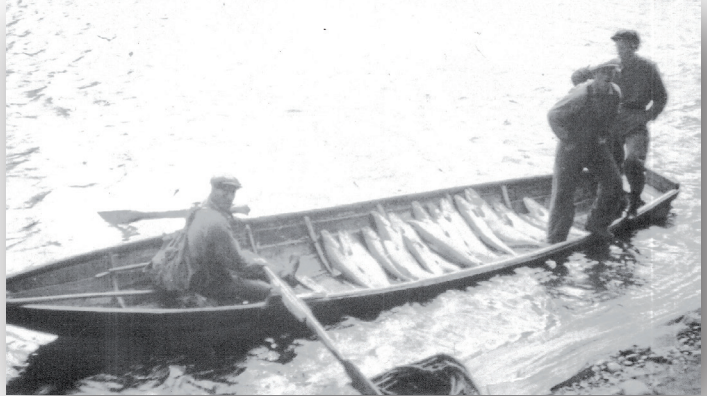
Det fanns gott om lax i Indalsälven en gång i tiden. Bilden är tagen vid Sillre Såg, men är från ett annat tillfälle än vad som berättas i artikeln.

Ett notvarp gick till så att en båt med noten gick efter stranden uppåt och där var det ju en egård vilket gjorde att strömmen ändrade riktning och gick uppströms. När man hade hela noten ute och att gubbarna på stranden höll i notändan gick båten ut i strömmen. Noten med sina sjunkstenar släpade botten och laxen som då var i omlopp följde med i noten och drogs i land efter att båten landas nedanför. Sedan började man dra in noten och den blev som en säck och väl intagen