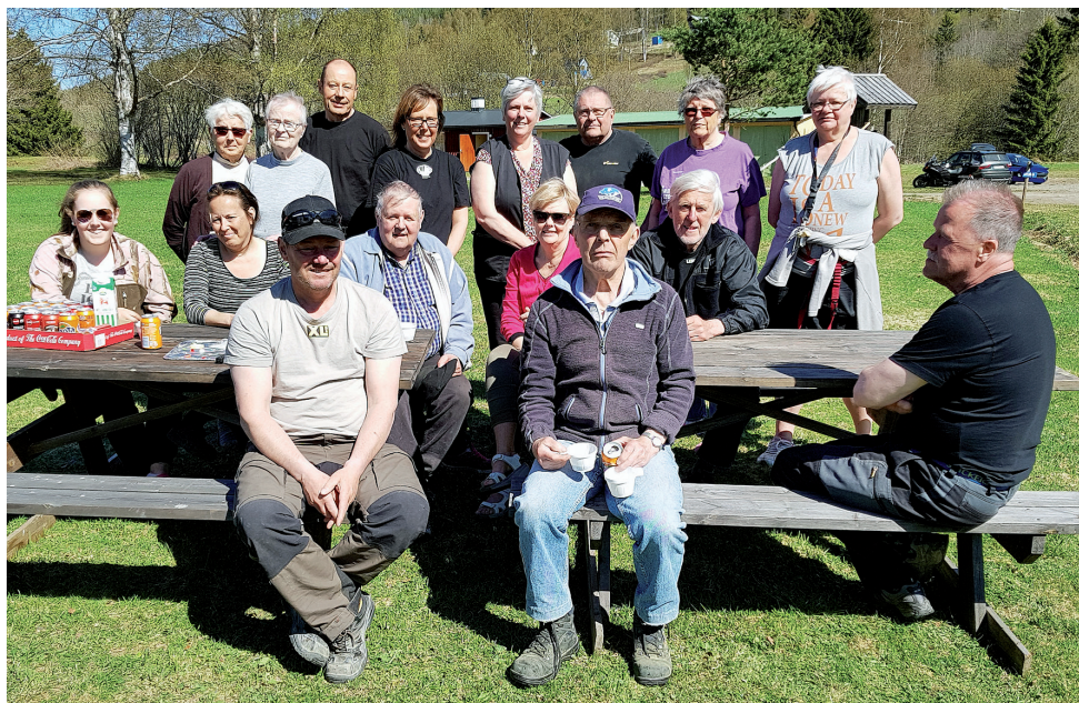
Vårstädning i Järkvissle Trollby 2018. Trotjänare och entusiaster på plats.