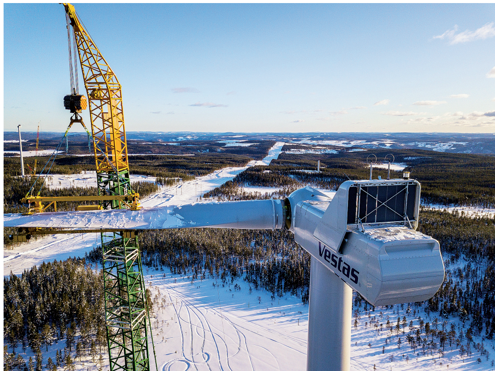
En av de drygt 62 meter långa vingarna lyfts på plats. Vikt: 12 ton per vinge.

Slutmonteringen pågår för fullt i vindkraftparken Jenåsen (belägen cirka 5 km öster om Liden). De 23 vindkraftverken kommer att placeras 370–405 meter över havet. Navhöjden är 127 meter. Med vingarna blir det betydligt högre, totalt 190 meter. Den installerade effekten skall uppgå till c:a 79 MW. Elproduktionen kommer att uppgå till mer än 250 miljoner kWh, d.v.s. förbrukningen av hushållsel hos c:a 50 000 hushåll. Enligt tidplanen sker montage av vindkraftverken under februari – maj. Upstart och provdrift maj – juni, för att slutligen vara i drift i juli.