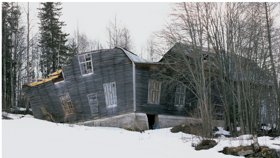
F.d. "danspalatset" Viljansborg i Sillre förstördes torsdagen den 22 mars 2018 av tunga snömassor. Taket gav vika över den stora samlingsalen. Bättre gick det för den del som inrymde bostad.

föreningen fastigheten till en privat intressent. Den extremt snörika vintern 2018 blev dock ödestiger. Torsdagen den 22 mars 2018 störtade delar av taket in p.g.a. de stora snötyngderna. Den 90-åriga "historiska" byggnaden fick därmed ett dramatiskt slut. Sista dansen har klingat ut!