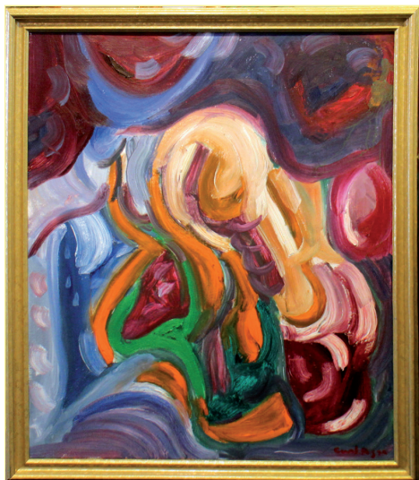
Tavla av Curt Agge.