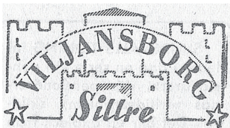
Logotypen för Viljansborg under storhetstiden på 1940- och 1950-talen.

laritet och de nöjeslystna sökte sig till andra lokaler. I början av 1970-talet sålde byggnads-