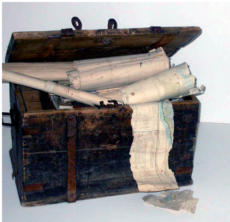
Exempel på bykista. I det här fallet från Ensillre by.

Lidens Hembygdsförening ska försöka ta reda på var bykistorna i Lidens socken finns någonstans. Bykistorna innehåller byarnas historia och de härstammar från den tid byalagen hade mycket att bestämma om.