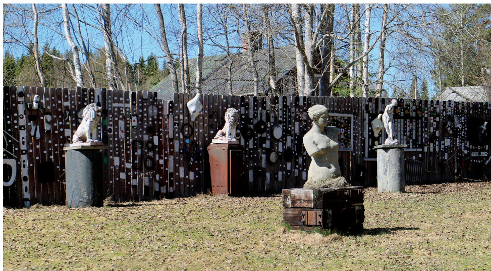
Utomhuskonst hos Curt Agge...