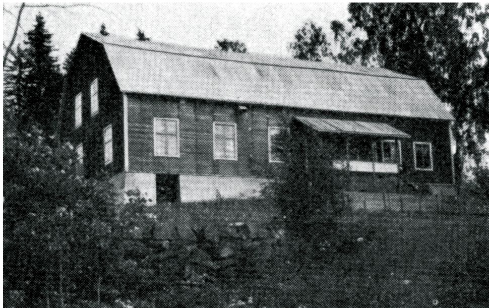
"Danspalatset" Viljansborg i Sillre i sin prakts dagar.

Under slutet av 1920-talet var det mycket folk i rörelse kring Sillre by. Kraftverket vid Indalsälven hade börjat byggas. Många huggare och hästkörare fanns på "Oxsjöfjället". Behovet av större samlingslokal blev angeläget. Sillre Byggnadsförening u.p.a. bildades 1928 och den imponerande föreningslokalen Viljansborg i Sillre uppfördes samma år. Byggnaden bestod av en mäktig samlingshall (med stor takhöjd) för 600 personer, en mindre lokal (kaféet) för 200 personer, ett kök samt bostad i en del av övervåningen.