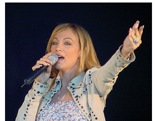
Charlotte Perrelli. Trollnatta 2002.

Ett stort antal artister har uppträtt under Trollnattakvällarna. Några mer kända än andra, som t.ex. Åsa Jinder, Eddie Oliva, Nanne Grönvall, Charlotte Nilsson (Perrelli), Titti Sjöblom, Sanna Nielsen, Henrik Åberg (The Legends), Brolle, Magnus Bäcklund, Östen mé Resten, Sarek, Roger Pontare, Timotej,