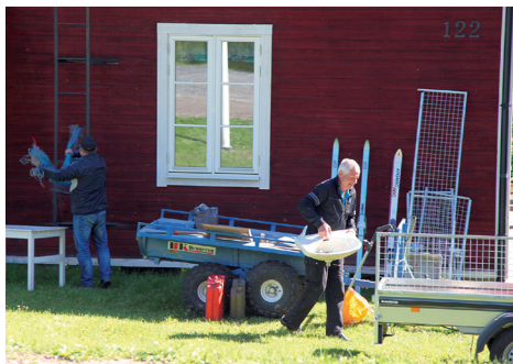
Vid bygdegården i Västanå kunde man fynda både ute och inne.

Men det gäller att vara tidigt ute om de verkliga fynden ska göras. Den som samlar på skandinaviskt glas kan hitta en värdefull Orreforsvas som ägaren inte uppskattar eller tycker är ful, men är konkurrensen stor gäller det att vara först på plan. Vid loppisrundan som de fem bygdeföreningarna anordnade runt Indalsälvens dalgång i mitten av juli, från Järkvissle i söder till Sönnerråsen och Utanede i norr, kom första kunden till Västanå