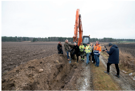
Fibergrävning utförs i möjligaste mån längs åkerkanter.