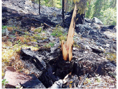
Blixtnedslaget på Hallstaberget