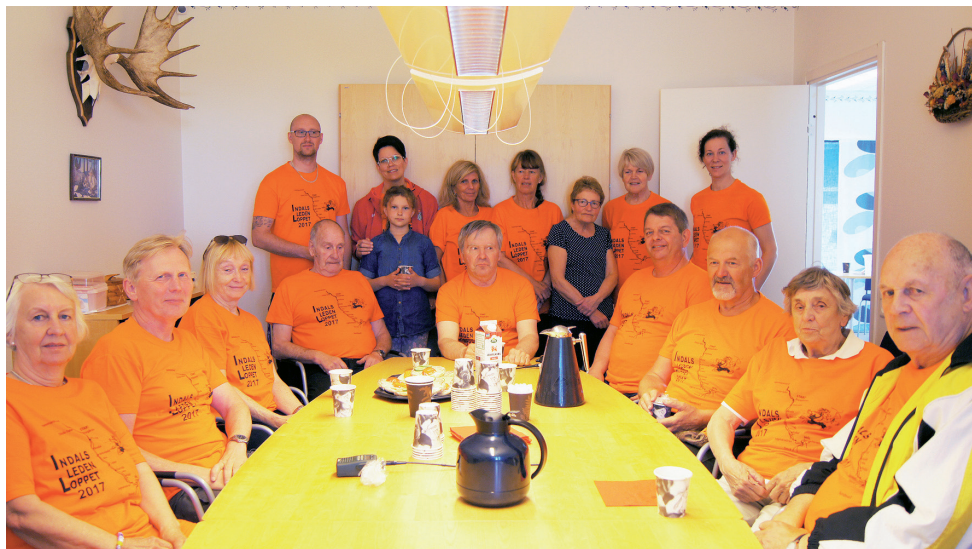
En välförtjänt kaffepaus efter avslutat värv för funktionärerna vid Lidenväxeln i 2017 års IndalsledenLoppet.