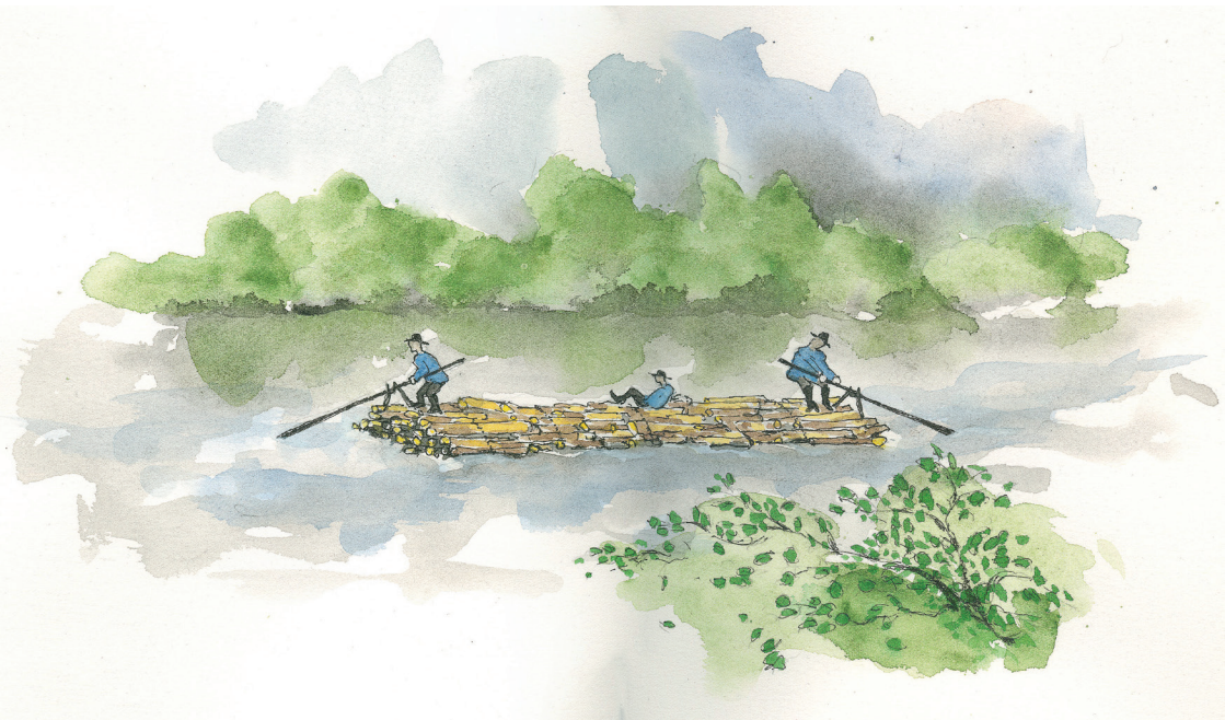
Bäst att sitta still i mitten om man är sjuk.