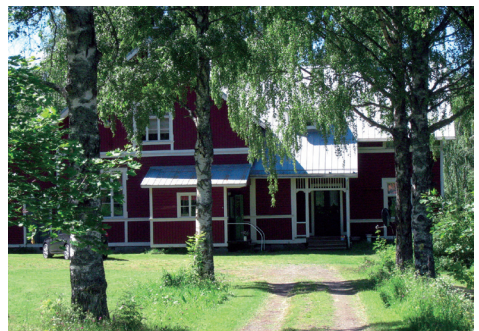
Bodas nedlagda men upprustade skola.