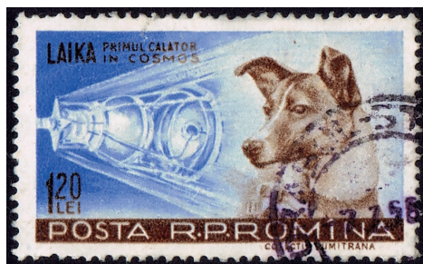
Hunden Lajka på rumänskt frimärke från 1957.

Vem minns väl inte alla som stod och tittade upp mot himlen och höll på att ramla baklänges vid halvfem-tiden på hösteftermiddagarna.