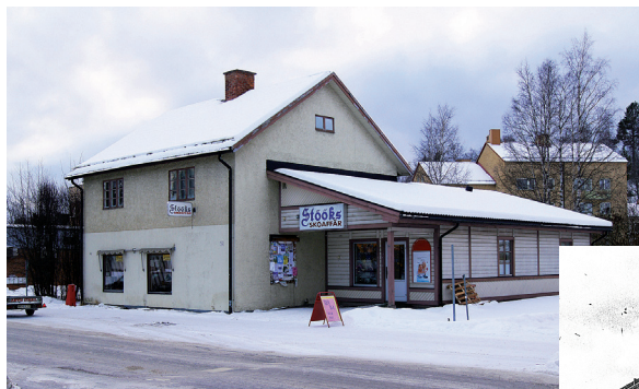
Stööks huset i Hammarstrand under byggnad år 1926. Tillbyggnaden till höger uppfördes under 1980-talet.