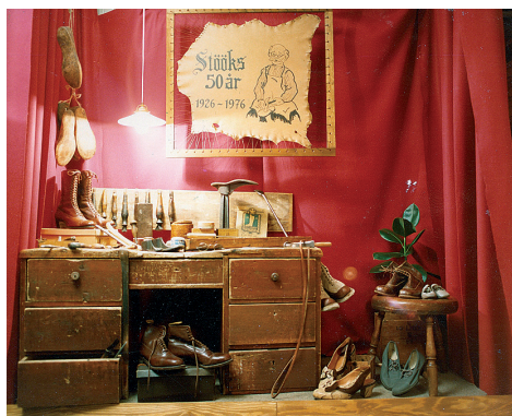
Skylltning vid 50 årsjubileet år 1976.