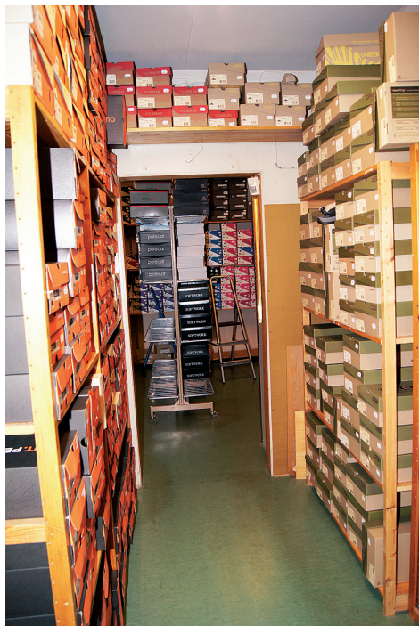
Det krävs stora lager i en skoaffär, särskilt om det dessutom bedrivs näthandel.