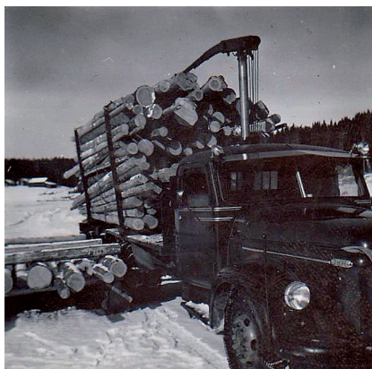
Virkestransport vid Skälsjön 1954.