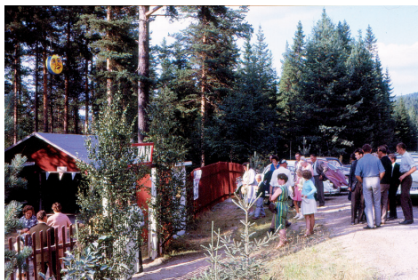
Entrén till Vältan. Landsvägen Sundsvall – Bispgården var bara på några meters avstånd (1963).

Det är en gåta hur alla dessa kvinnor och män kunde koppla om från sina hårda arbeten och höja sig in i lite glädjeskutt. I vardagslag sågs