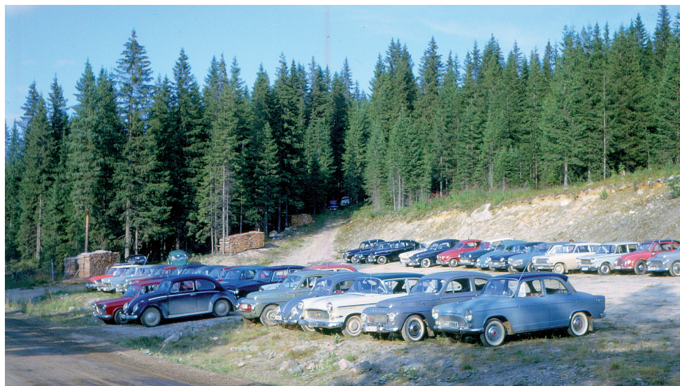
Det var fint att ha egen bil, så det började bli trångt på parkeringen (1964).