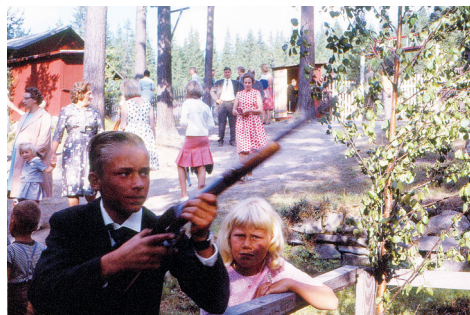
Det fanns skjutbana på Vältan. Kaffeserveringen i bakgrunden (1963).