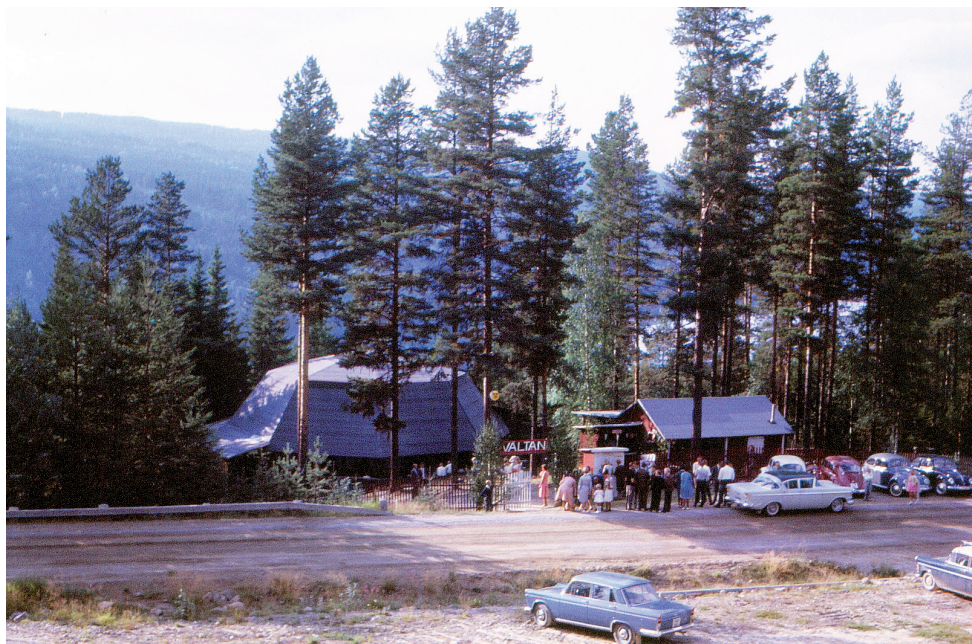
Dansbanan Vältan norr om Järkvissle by med den storslagna utsikten över Indalsälven (1963).