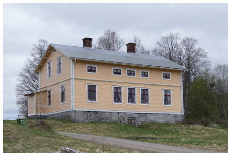
Hälla Gård i Åsen, Liden; med anor från 1600-talet.