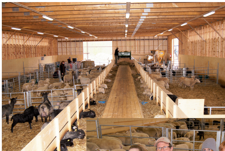
Interiören av nya fårhuset (15 m x 35 m) på Hälla Gård.