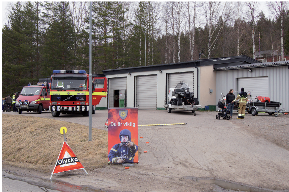
Öppet hus vid Räddningstjänsten i Liden lördagen den 25 april 2015.