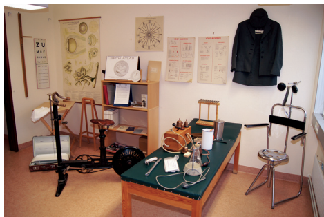
Omedelbart till höger om apoteksingången finns en utställning av tidigare föremål inom sjukvården och apoteksrollen.