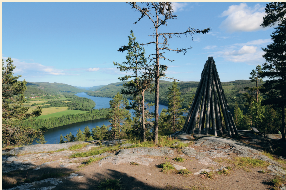
Bild från Vättaberget