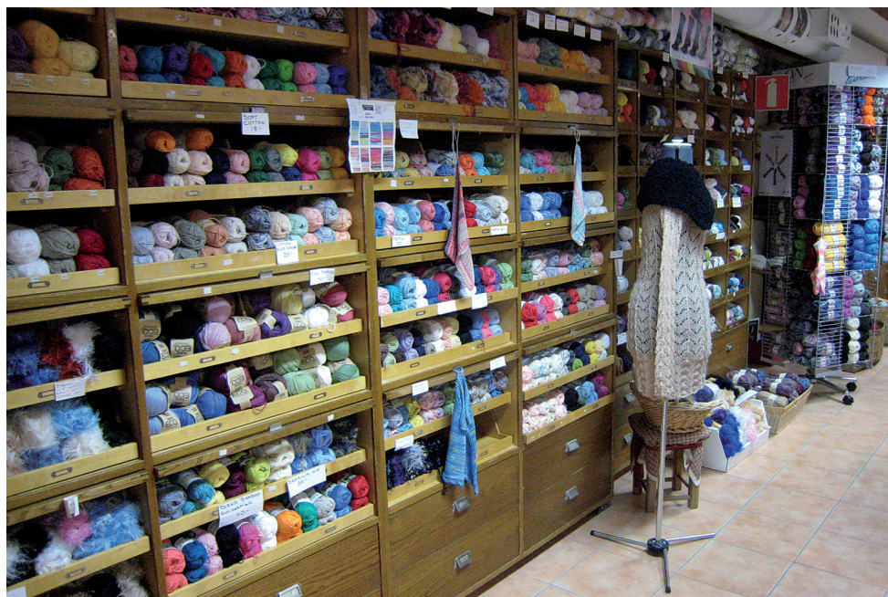
Monterksåpen med garn i alla regnbågens färger och mer därtill hämtades från en nedlagd damkonfektionsbutik Bollnäs.