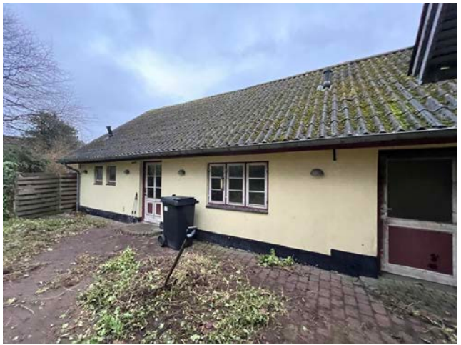
Udsende ved køb december 2023