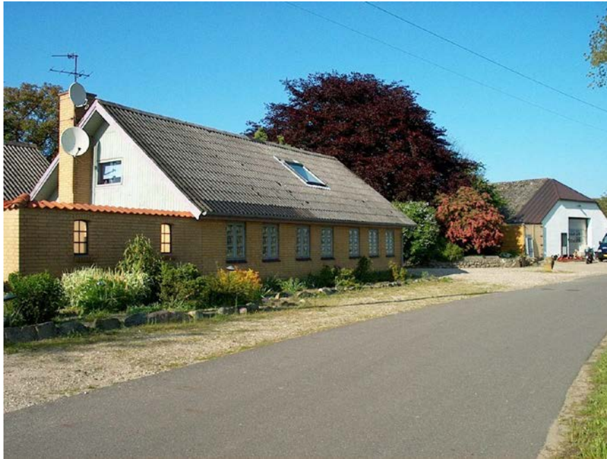
Billede fra 2019

Den 13. okt. 2000 sælger Tom Møller huset til Luffe Herluf Buch for 563095kr.