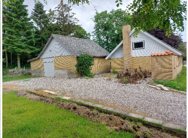
Udsende juli 2024