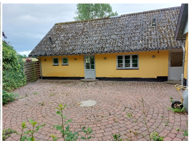
Udsende juli 2024