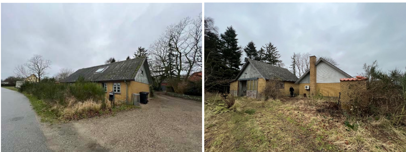
Udsende ved køb december 2023