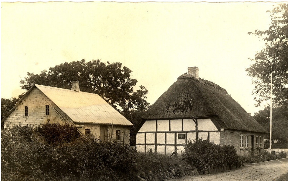
Billede fra 1926