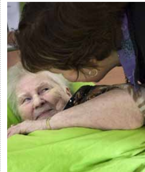
Zewopa biedt hulp bij dagelijkse verzorging.

Overall in Vlaanderen zetten ziekenhuizen, woonzorgcentra en andere zorgorganisaties hun deuren open op 17 maart. Ook vzw Zewopa uit Berchem doet mee.