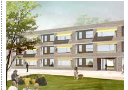
Zicht op het nieuwe binnenplein.

Aan de Kanunnik Peetersstraat en de Frans Beckersstraat verrijzen een nieuw dienstencentrum en zestig serviceflats. De verkoop van de flats start op 8 april.