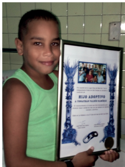
En kubansk pojke som får en bättre tillvaro genom den svenska donationen.