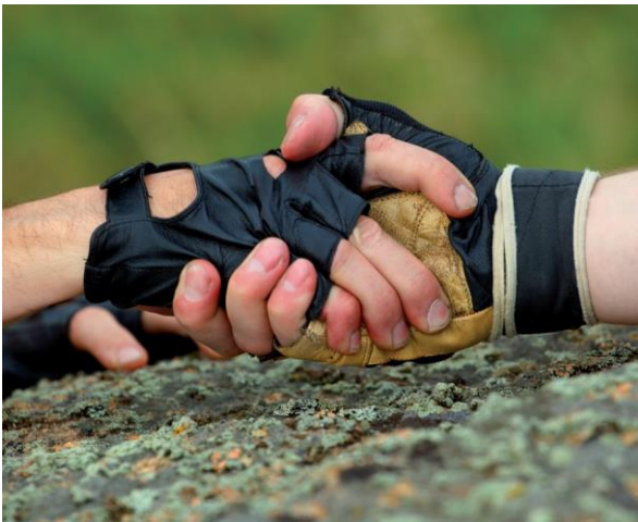
Gennem coaching hjælper mentor mentee med at håndtere konflikter og overskue regler i forhold til det at være ledig.

Der kan være tale om borgere, der kun har haft sporadisk kontakt med det danske arbejdsmarked og/eller endnu ikke har været selvforsørgende i Danmark.