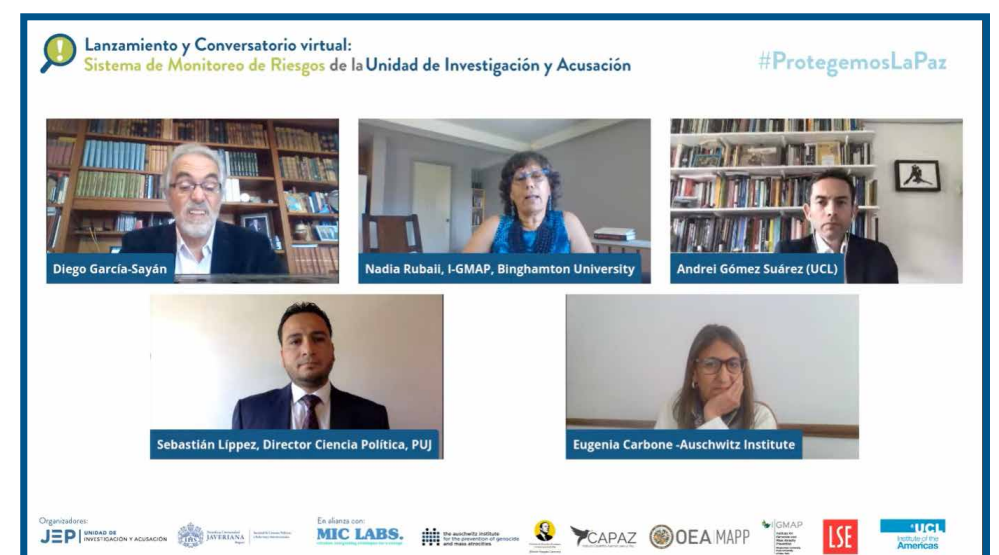
Lanzamiento y Conversatorio virtual: Sistema de Monitoreo de Riesgos de la Unidad de Investigación y Acusación