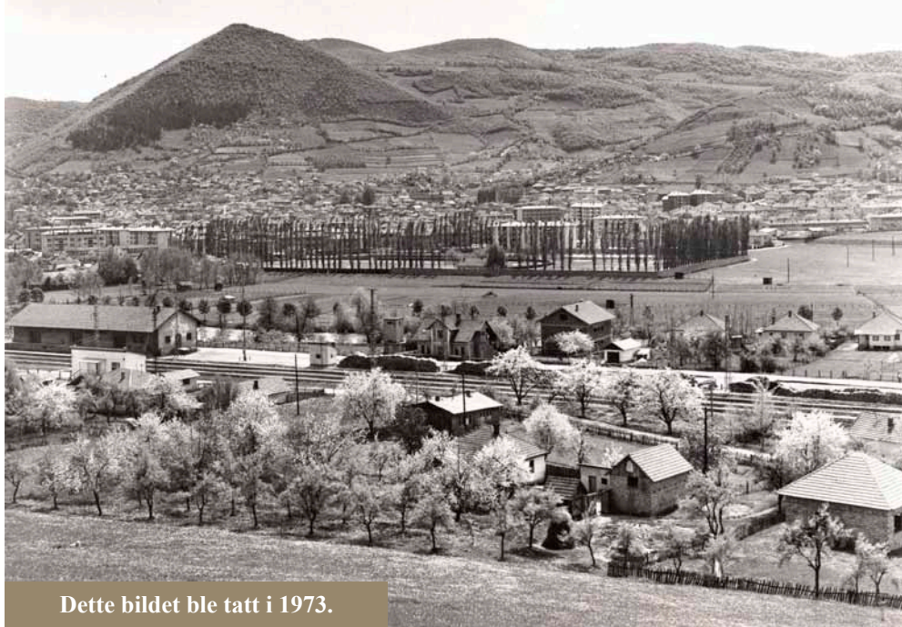
Dette bildet ble tatt i 1973.

Men det var ingen bløff! Nå er nok tonen en annen da det er bekreftet fra flere vitenskapelige hold at det er, ikke