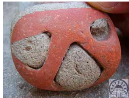
Stein ”amulet” funnet i området.