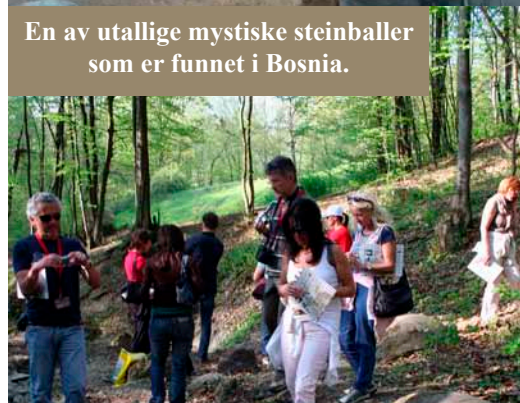
En av utallige mystiske steinballer som er funnet i Bosnia.