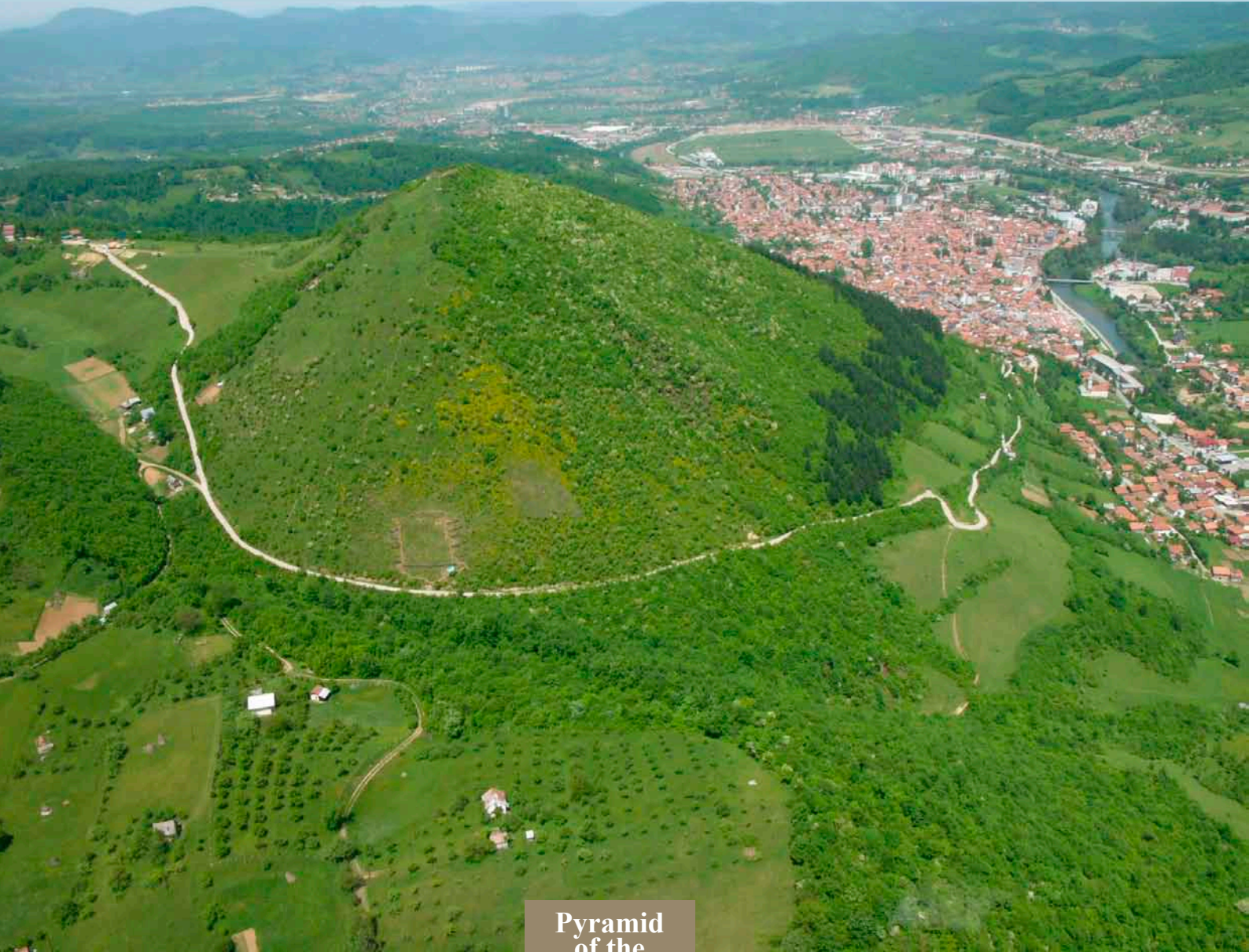
Pyramid of the Sun