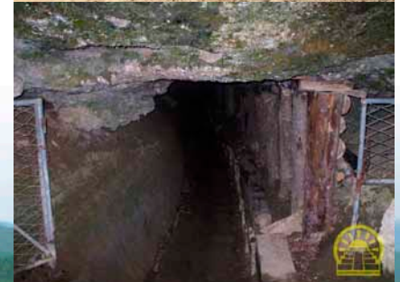
Bildene ovenfor er fra utgravingene.