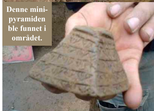
Denne mini-pyramiden ble funnet i området.