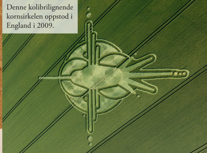
Denne kolibrilignende kornsirkelen oppstod i England i 2009.