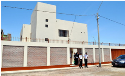
The Yamagata University Faculty of Literature and Social Sciences i Japan åpnet høsten 2012 et forskningssenter ved Nazca. Senteret de har bygget skal i mange år fremover forske på fenomenet.