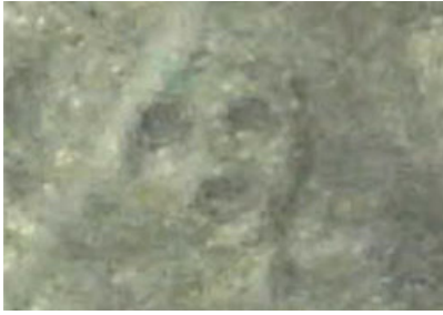
Et japansk forskningsteam har nylig funnet et par nye små figurer på noen få meter. Den ene viser et ansikt.