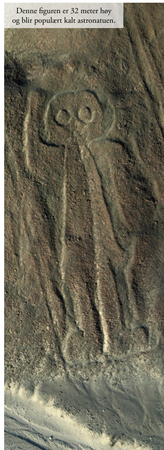
Denne figuren er 32 meter høy og blir populært kalt astronauten.