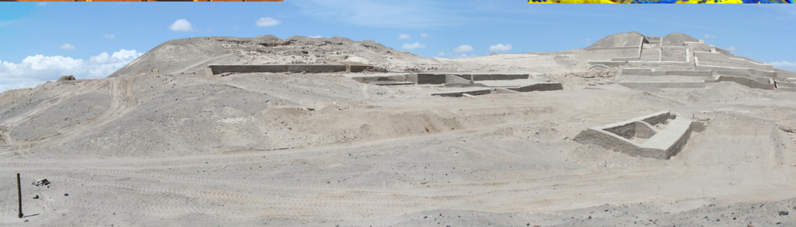
Bilde fra utgravningsområdet i Cahuachi.