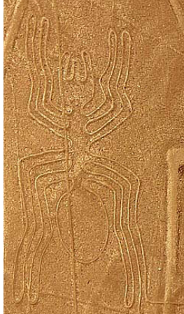
Denne figuren blir kalt edderkoppen.