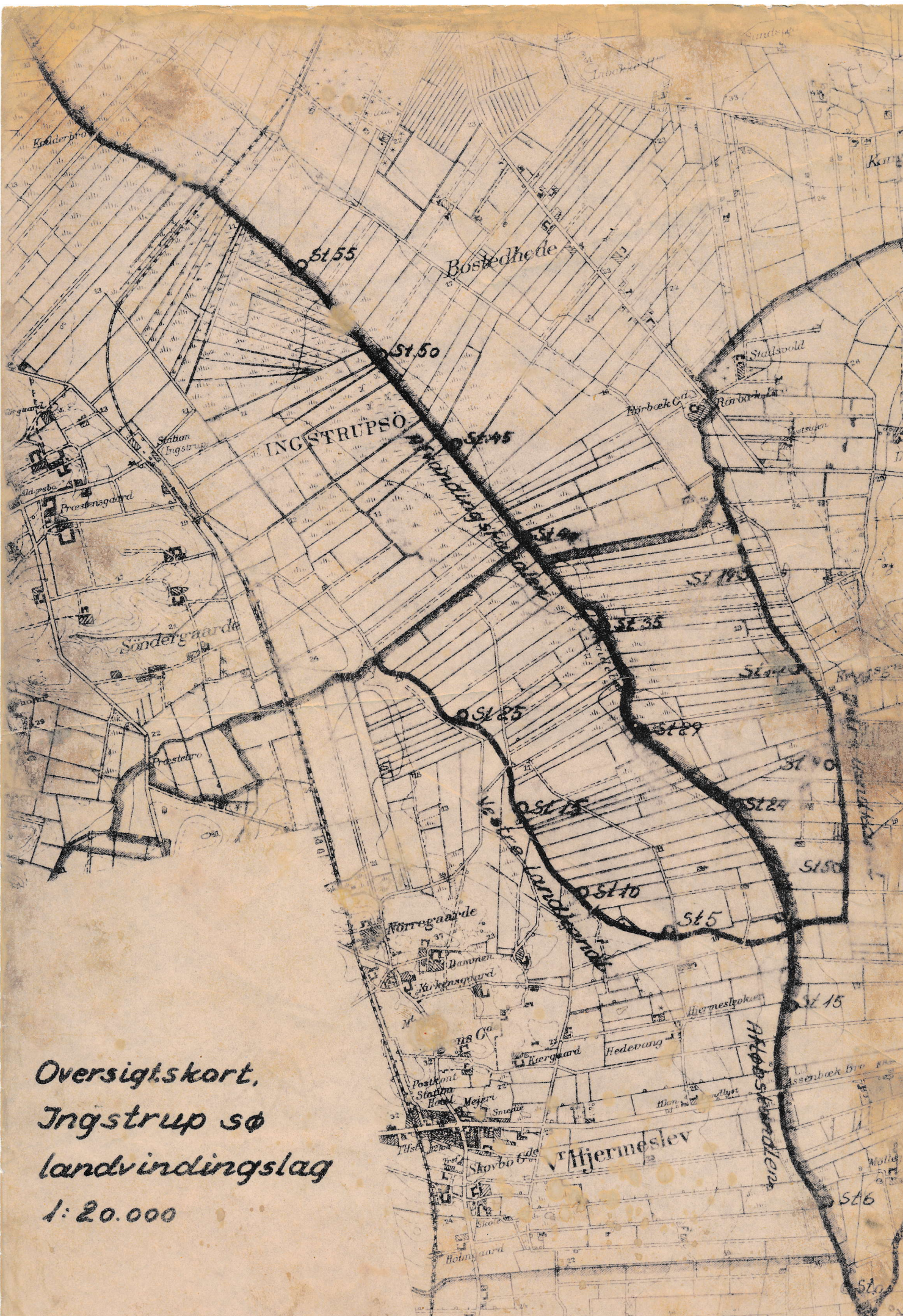
Oversigtskort, Ingstrup sø landvindingslag 1:20.000