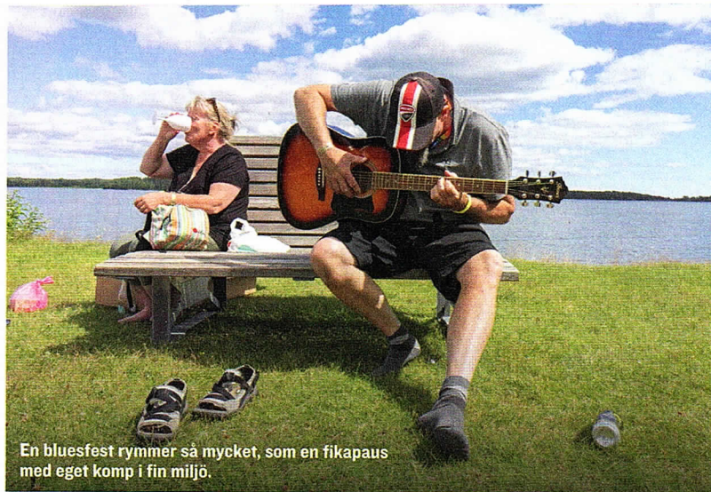
En bluesfest rymmer så mycket, som en fikapaus med eget komp i fin miljö.

Några julidagar varje år samlas bluesentusiaster i Dalslands största lilla stad.