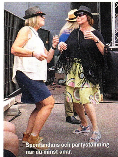
Spontandans och partystämning när du minst anar.