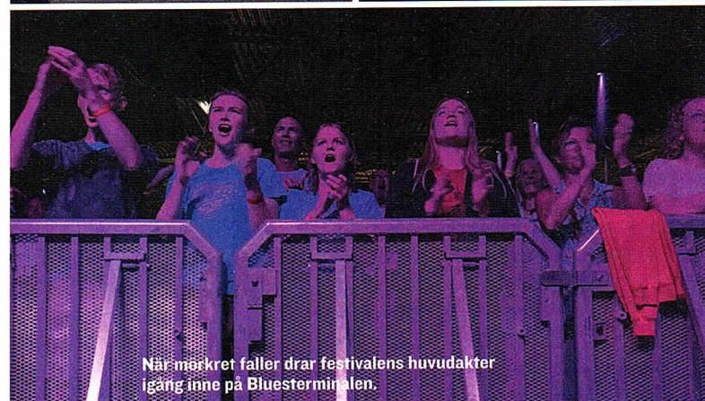
När märket faller drar festivalens huvudakter igång inne på Bluesterminalen.

► gärna lyfta fram mindre kända artister också. Men vi är väldigt nogga med att de håller hög nivå.