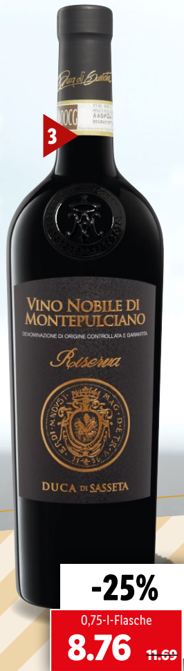
2014 3 Duca di Sassetta Vino Nobile di Montepulciano DOCG Riserva