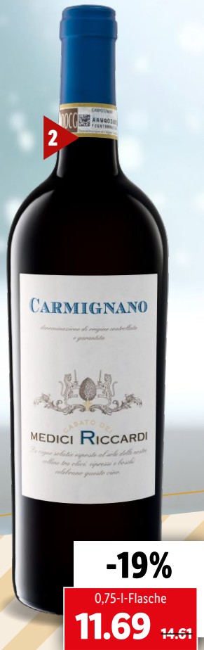
2015 2 Casato dei Medici Riccardi Carmignano DOCG