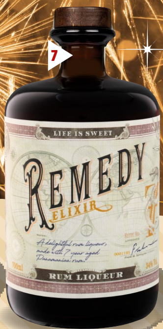
7 Remedy Elixir

Panama Alkoholgehalt: 34,0 % Vol. Remedy Elixir ist ein edler Likör, der auf Basis eines panamaischen Rums hergestellt wird. Dieser Rum wird aus einer reichhaltigen Melasse gewonnen und bis zu sieben Jahre in Eichenfässern gelagert. (1l = 25,06) Art.-Nr. 100311691