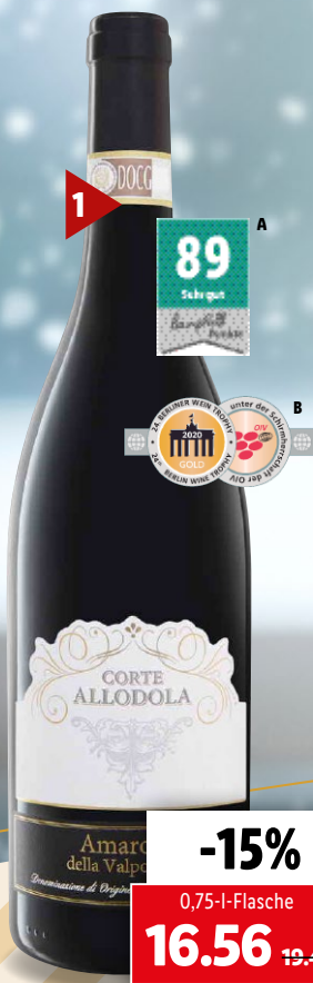
2016 1 Corte Allodola Amaro della Valpolicella DOCG