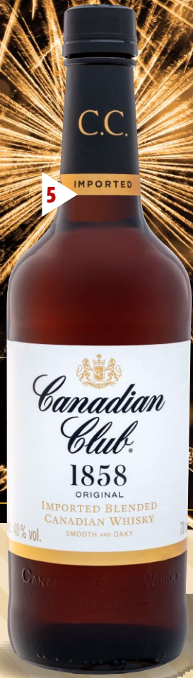
5 Canadian Club Blended Canadian Whisky

VERANTWORTUNGSVOLLER GENUSS ab 18 Jahren