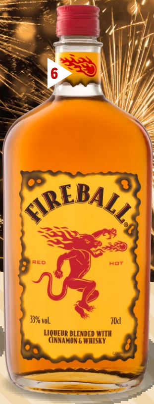
6 Fireball Likör mit Zimt und Whisky

Kanada Alkoholgehalt: 33,0 % Vol. Eine Legende besagt, dass dieser Likör im kältesten Winter produziert wurde, den Kanada jemals erlebte. Ein Wissenschaftler behauptete, dass er etwas habe, um Erfrierungen zu vermeiden: die Kombination von Whisky und Zimt. (1l = 18,09) Art.-Nr. 100216421