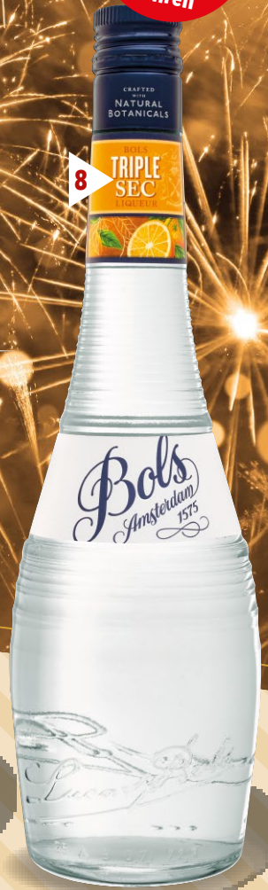
8 Bols Triple Sec

Amsterdam/Niederlande Alkoholgehalt: 38,0 % Vol. Die Sorte Triple Sec darf natürlich in keinem Likörsortiment fehlen, denn zahlreiche berühmte Cocktails verdanken der farblosen Flüssigkeit ihre orangig-fruchtigen Nuancen. (1l = 13,22) Art.-Nr. 100312326