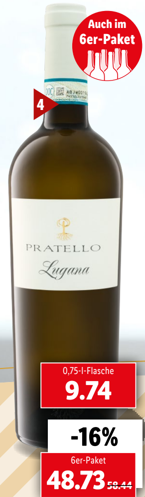
2019 4 Pratello Bio Lugana DOC