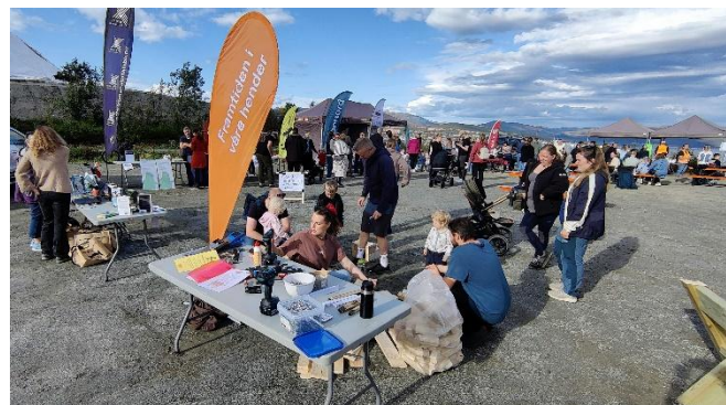
Det var mange stands å besøke.

Krokendagen ble gjennomført lørdag 13. september 2025 på parkeringsplassen ved alpinparken. Mange store og små tok del i dagen. Områdesatsingen, Framtiden i våre hender, Bonord, Kroken kirke,