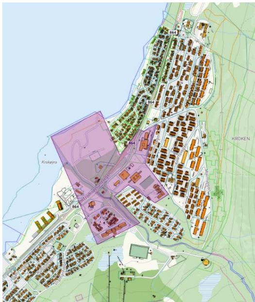
Planområdet for Kroken bydelssenter.

Tromsø kommune ønsker å styrke Krokens bydelssenter, slik at det får enda mer å tilby hverdagslivet i Kroken, at det forbedrer eller tilbyr flere utendørs møteplasser, at det er attraktivt å gå, sykle og ta buss i bydelen.