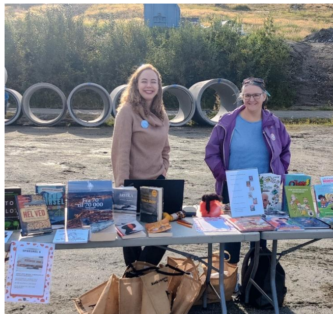
Biblioteket i Kroken er viktig! Og til stede på Krokendagen.

Sett av lørdag 12. september 2026 – da blir årets Krokendag!