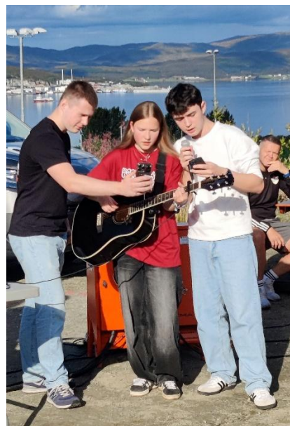
Sang ved ukrainske ungdommer.