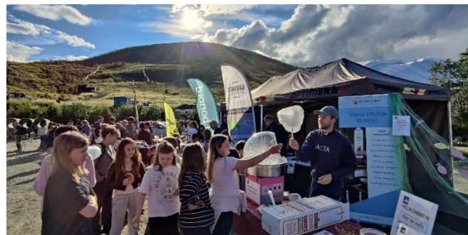
Sukkerspinn er populært! Kroken-prestene står for søte bidrag.