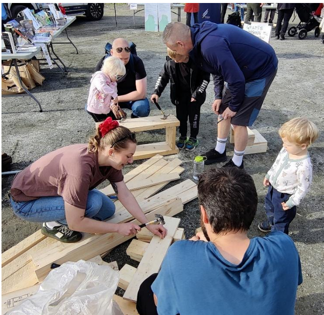
Framtiden i våre hender tilbyr snekring for de minste.

Vi planla også en markering på fritidsklubben i f.m. deres 40-årsjubileum. En stor vannlekkasje i deres lokaler på Krokensenteret satte stopper for disse planene.