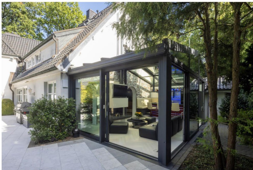
Showroom Hamburg, Tyskland