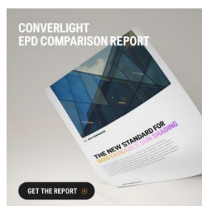
Digital kampanj: Ladda ned en jämförelse av miljöpåverkan av olika solskyddslösningar

Vi har under kvartalet arbetat med att på olika sätt stärka bolagets finansiella ställning. Vi är tacksamma att våra större aktieägare valt att stötta bolaget genom en riktad emission. Vi har även fortsatt arbetet med att söka andra typer av finansiering.