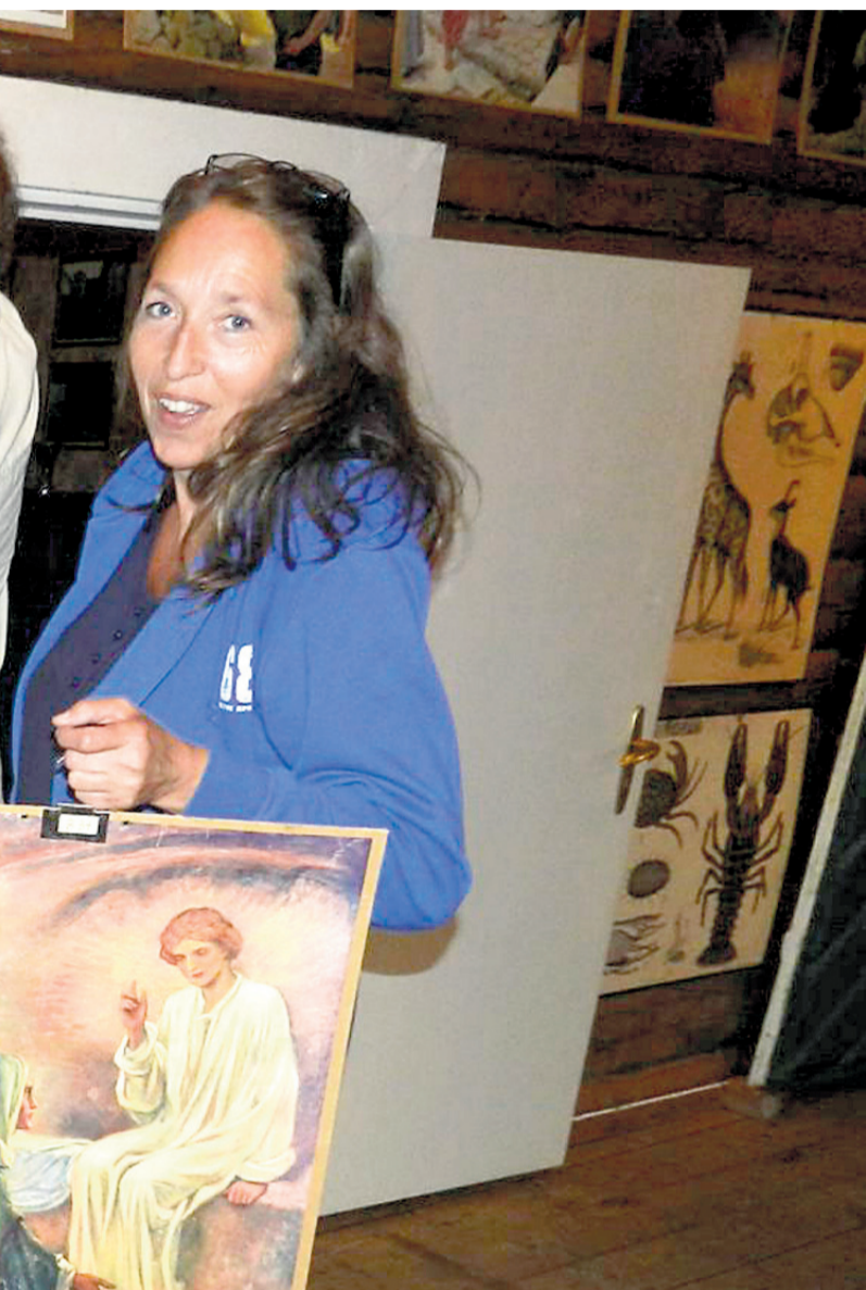
g, Asak og Prestebakke skoler. På helgens sensommerstevne på Gamle Alle