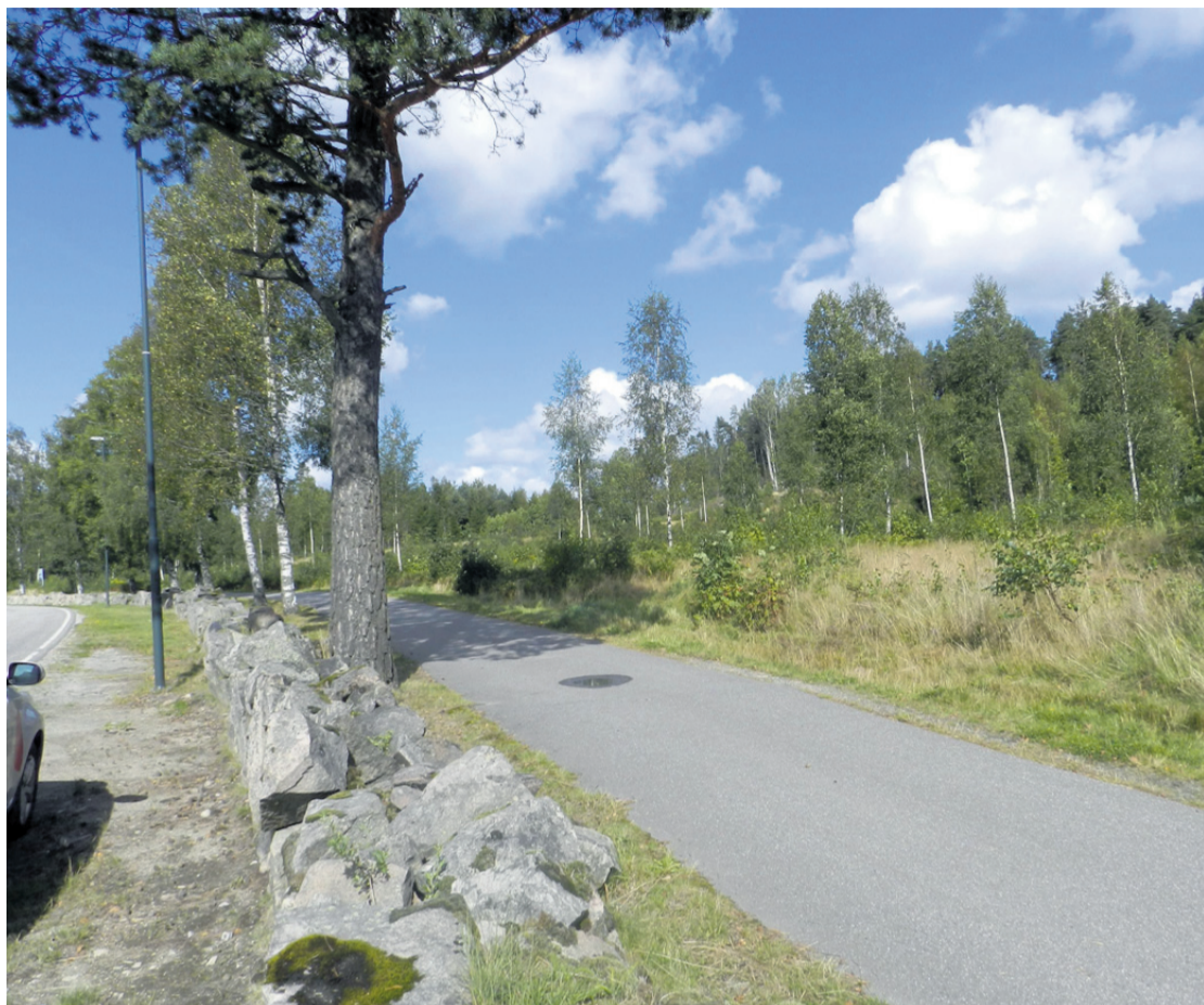
Her, mellom grustaket i Oreid og Danseberget, er det planer om ny barnehage.