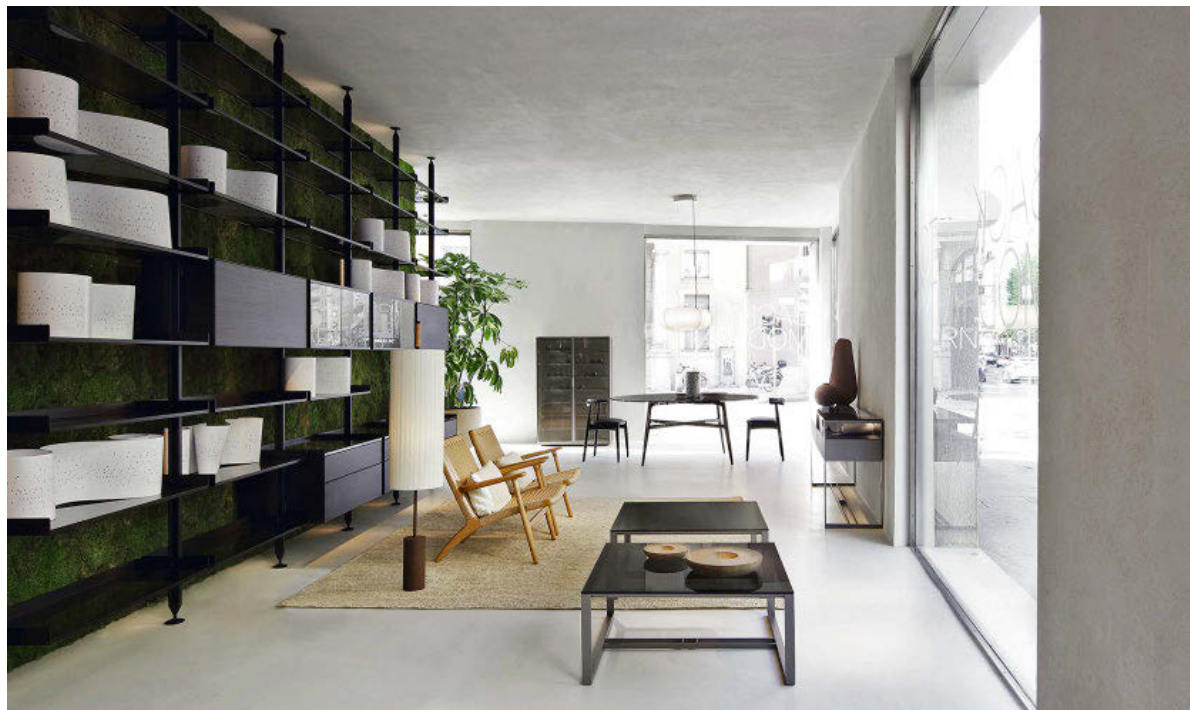
RENOVARSE O MORIR. Vista de la “flagship store” de Rimadesio en Milán; ubicada en un edificio histórico, ha sido remodelada bajo la batuta de Giuseppe Bavuso como un sobrio escenario para las nuevas colecciones.

Están a gusto los dos protagonistas. Se percibe. Como si fuera su casa. “Iconno está enamorado de nosotros, de nuestros diseños. Los interpretan con el mismo espíritu con el que los diseñamos; además son estimulantes, siempre buscan algo más, nos piden cosas nuevas”, apunta Malberti. Aparte de esta declaración (de amor), se han dejado caer por este enclave cercano al Parque de El Retiro para dialogar ante un reducido combo de invitados sobre la