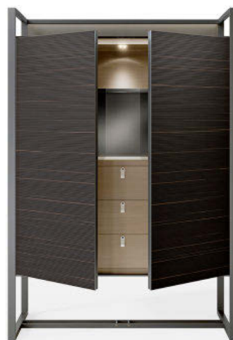
MUEBLE BAR. De aluminio con puertas de madera, pertenece a la línea Rialto. Desde 1.944 euros.

Se llevan bien los dos. Coinciden en que se siguen sorprendiendo entre ellos, en que Rimadesio es una responsabilidad compartida, en que trabajan con un voz única, en que el objetivo es siempre ofrecer algo original... ¿Habría algo en que no estén de acuerdo? “Discutimos mucho, pero nunca desde un punto de vista personal”. ◀