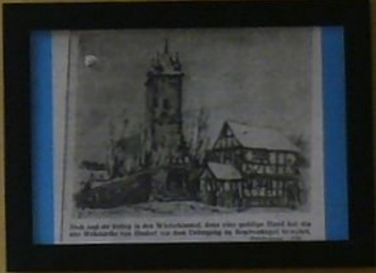
in den Augen der Kunst