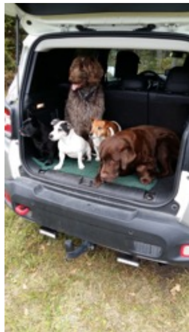
Alva och tryffeljägararna