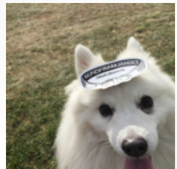
HUNDLÖPET LÄS SID 2