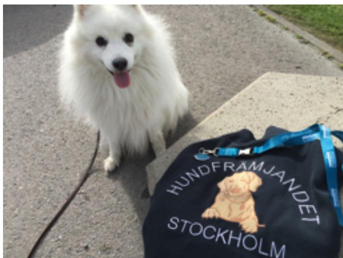
Lilleman laddar inför starten.

Besvär med snö som fastnar i pälsen och bildar klumpar?