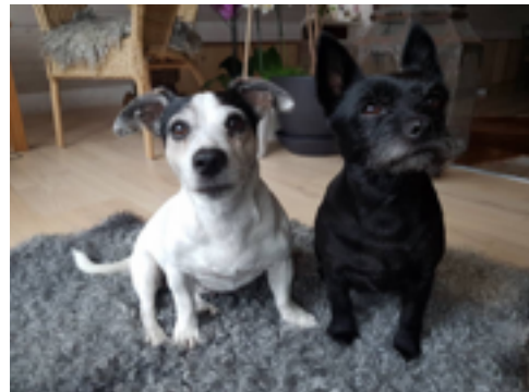
Linns båda hundar

När det gäller tryffel ska man tänka på att den ej blandas med mat som ska tillredas varmt.