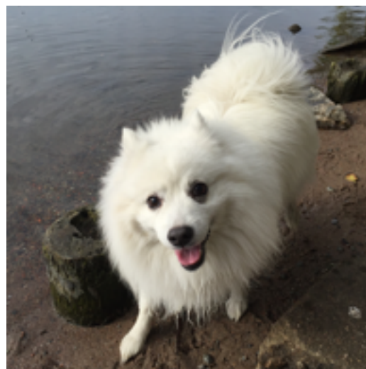
Dopp i kanalen som belöning