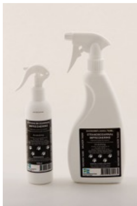
Ett exempel på snöskydds-spray

Annars är en overall med bra passform alltid ett alternativ som även värmer hunden ute i kylan.