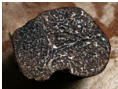
TRYFFELJAKT LÄS SID 3