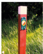
Eksempel på post