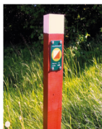
Eksempel på post