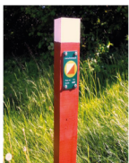
Eksempel på post