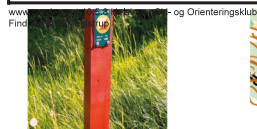
Eksempel på post