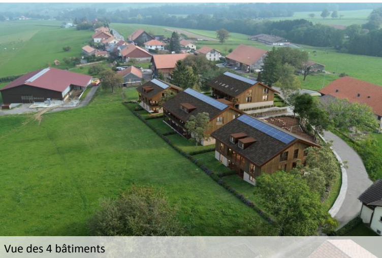
Vue des 4 bâtiments