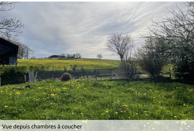
Vue depuis chambres à coucher