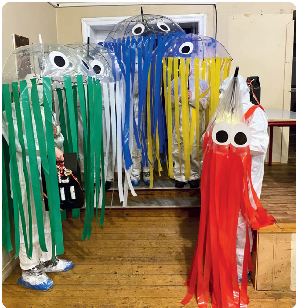
Fra Helligtrekonger 10. januar. Gopperne fik 1. præmie for udklædning.