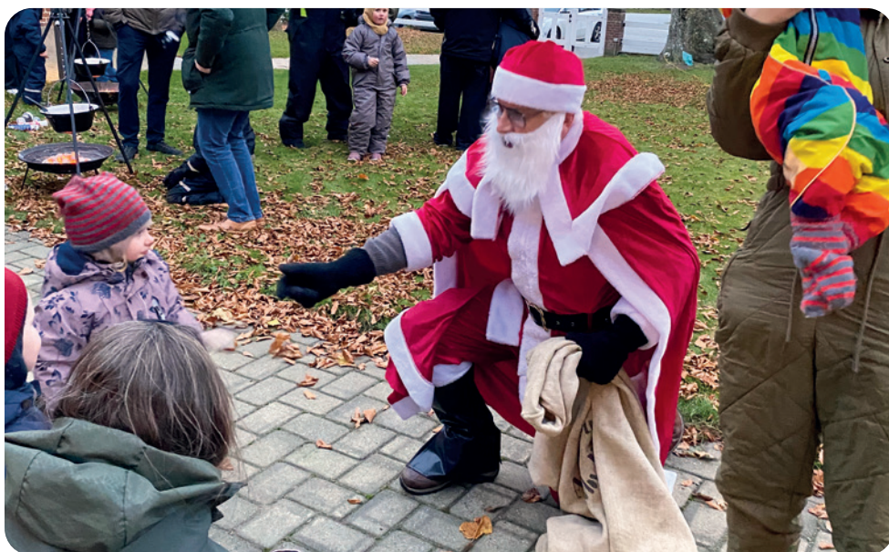
Fra juletræsfesten november 2025.