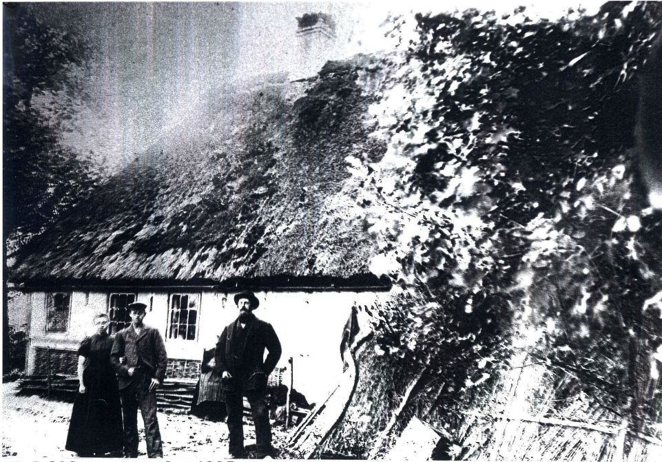
Ved Oldenor omkr. 1905