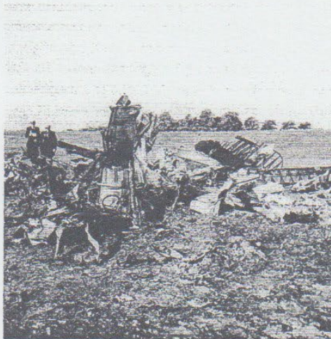
Vraget af Halifax W1226 J fra 35 Sqdn. ved Ladegården ca. 1.5 km sydøst for Sønderborg. Flyet blev skudt ned af en tysk nat jager 5./NIG 3, men det lykkedes for hele besætningen at springe ud med faldskærm.

Piloten var en fri mand her i Danmark osv. Men nu blev det mig dog for broget, og jeg bad ham om hans personalia. Disse blev mig nægtet, og en ung pige, som i mellemtiden havde sluttet sig til den unge mand med råbet: »Hvis du skal med, vil også jeg med,« Var ikke mindre ordknap.