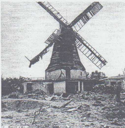
Holm Mølle efter det massive fejlbombardement af Nordals natten mellem den 18. og 19. august 1942.