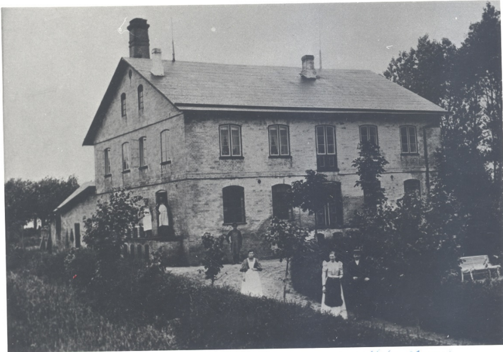
Helm Mejeri 2-19.