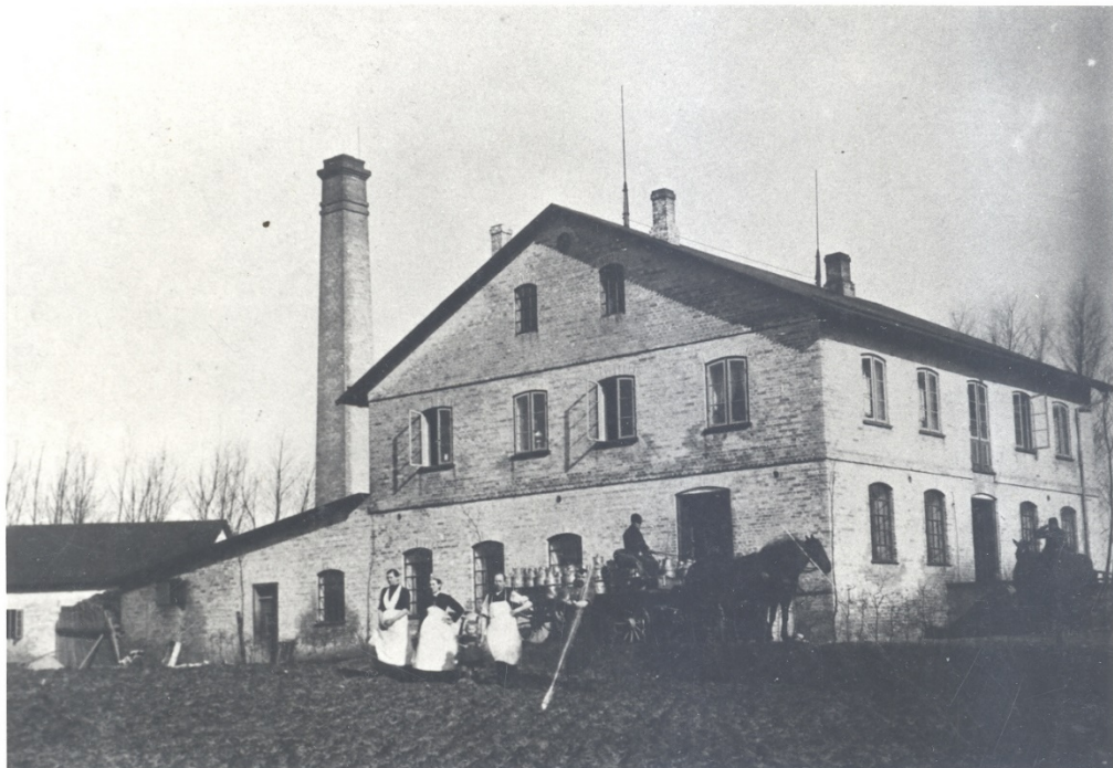
Helm Mejeri 2-7