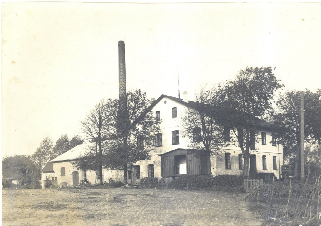
Holm Andels-Mejeri i 1930erne.

Billedet er taget i 1930erne efter at det har fået en ny Skorsten, den gamle var firkantet. Der er bygget et Træhus på Peronnen mod vest hvor Udvejningen foregik.