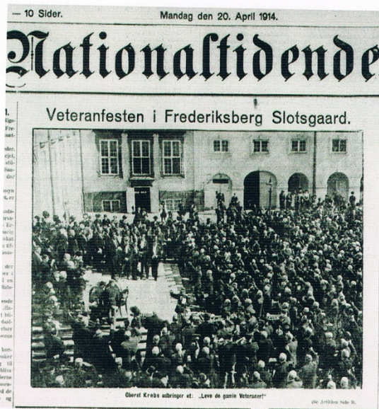
Det store veteranstævne fik stor omtale i tidens aviser. Her er et billede fra Frederiksberg slotsgård kommet på forsiden af Nationaltidende den 20. april.

Under opholdet var der for alle veteraner, der bar emblem, gratis kørsel med alle sporvogne, og gratis adgang til forskellige museer og biografteatre. Det har været en stor begivenhed for folk fra hele landet, hvoraf mange nok ikke var vant til at færdes i hovedstaden. Men udenbys veteraner skulle ikke føle sig fortabt i storbyen, for de var når som helst i løbet af dagen velkomne i Kristelig Forening for unge Mænds Soldaterhjem i Gothersgade 115. Her ville der stå et dækket kaffebord til fri rådighed.