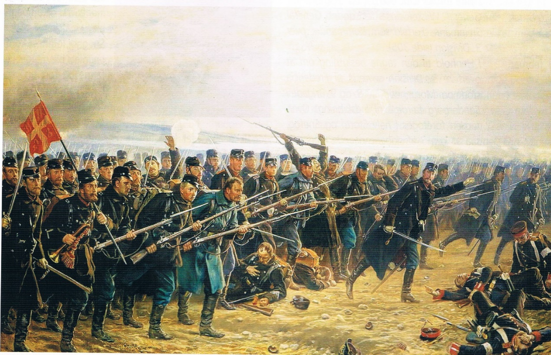
8. Brigades berømte modangreb ved Dybbøl. Maleri af Vilhelm Rosenstand.