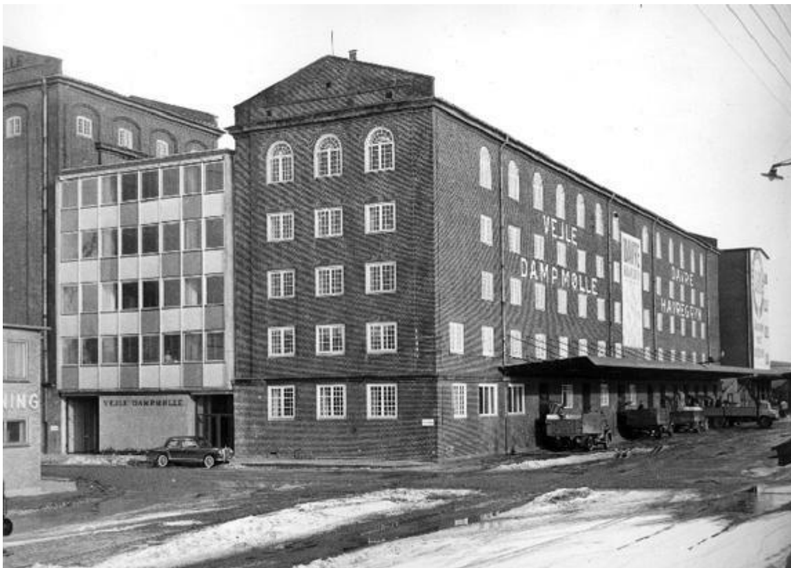
Vejle Dampmøllens bygning på havnens sydkaj ved indvielsen i 1960. Bygningen er set fra Pakhusgade.