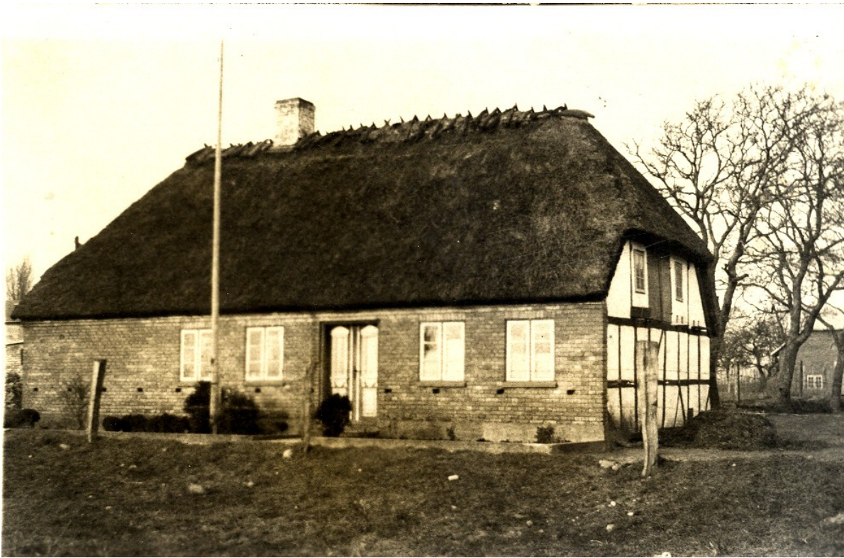
Damgade 22 Mat. Nr. 46