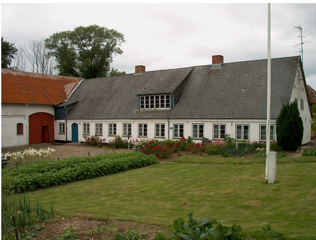
Brønd 11 ( Tinghøjgård ) Halvbol nr.62 Matr. Nr.33

En hellig kilde, hvis vand havde en helbredende kraft, fandtes ved Tinghøj . Allerede for årtusinde var denne kilde bekendt. De syge kom i større skarer, ved at drikke af det hellige vand og vaske de syge lemmer i vandet, fandt enhver helbredelse. – Disse folk blev boende i nærheden af ” Helligkilde ” og snart var stedet bleven til en blomstrende landsby, som fik navnet Holm.