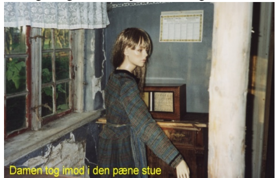
Damen tog imod i den pæne stue

I huset er man i gang med spisekammeret. Det er en større opgave, for der er meget at sortere: der er gamle køkkenredskaber, der er flasker og glas i alle aldre og størrelser. Hvad må væk, og hvad skal gemmes? Det tager nogle dage at komme igennem.