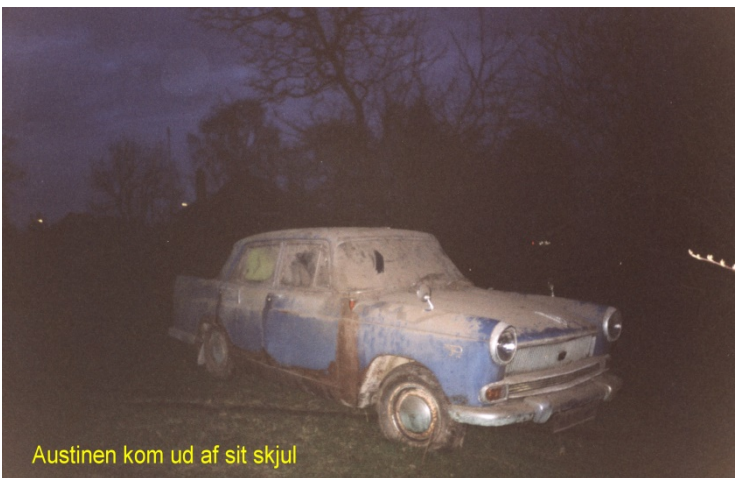
Austinen kom ud af sit skjul

Den 26. april 01: Der skulle igen arbejdes med sten i Pøl, så jeg skulle igen være her, ifald, der kom gæster, men denne aften blev helt anderledes.