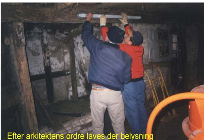
Efter arkitektens ordre laves der belysning