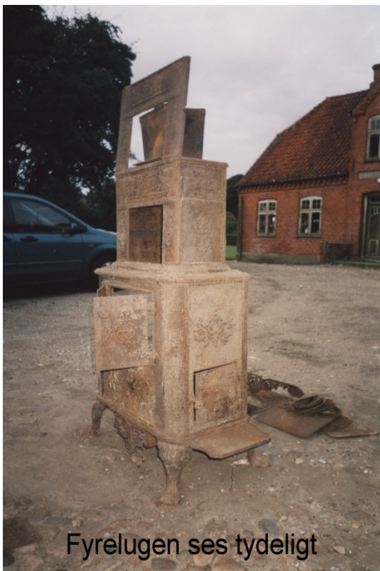
Fyrelugen ses tydeligt

Den 9. august 01: Det har i den sidste tid regnet meget. Vandet har skyllet på gårdspladsen, så der var lidt at feje og trille væk. Åge var mødt med trailer, der blev læsset med en ordentlig stabel sække med affald fra loftet. Andreas fik flyttet nogle buksbom. De store buksbom står i vejen, når muren skal bygges om. Der var stadig folk på loftet, der blev slået græs, og der blev lavet forskelligt. Der var også interesserede gæster.