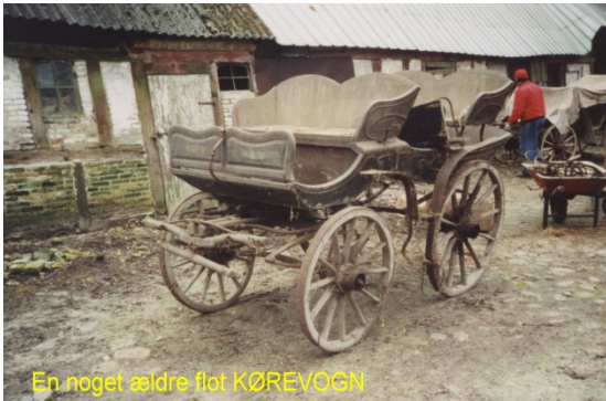
En noget ældre flot KØREVØGN

Efter at holdet har arbejdet næsten hver onsdag aften med et større eller mindre mandskab, var det blevet for mørkt om aftenen, og den 3. oktober blev der igen gået over til lørdag formiddag.