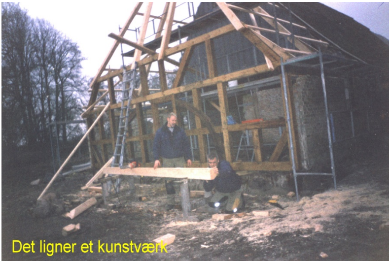
Det ligner et kunstværk

Den 10. juli: Jeg var syg. Det var en smuk aften.