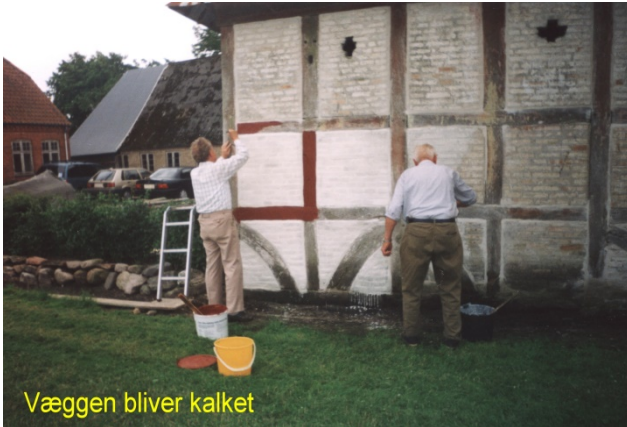
Væggen bliver kalket