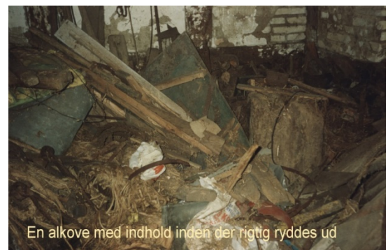
En alkove med indhold inden der rigtig ryddes ud

Der blev også slået blikplader for hullerne i muren i bindingsværket.