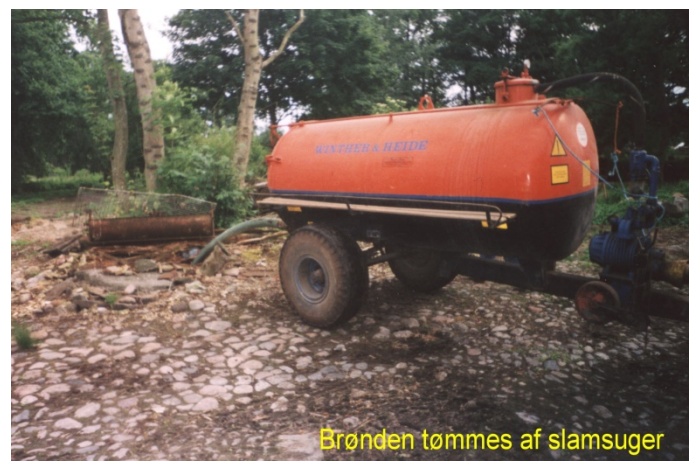
Brønden tømmes af slamsuger

Der var en rendegraver, der planede det afskrabede stykke pænt af. Andreas havde en slamsuger med der blev tømt to brønde. Op af teglstensbrønden