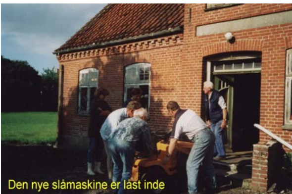
Den nye slåmaskine er låst inde