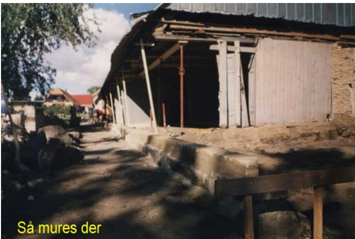
Så mures der

Der blev fjernet skillevæg og nogle døre.