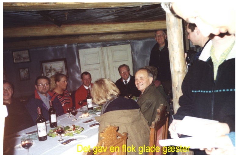
Det gav en flok glade gæster