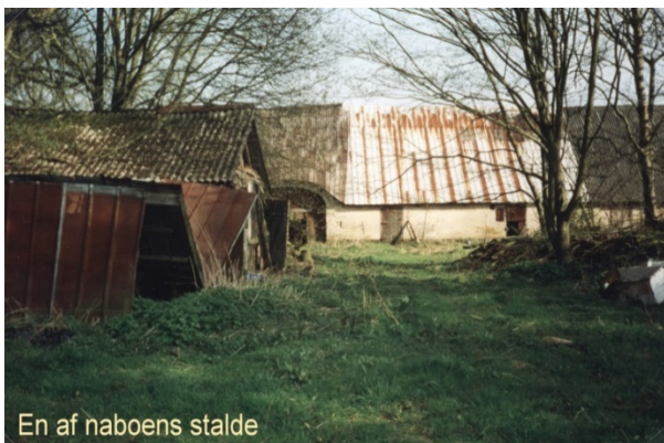
En af naboens stalde