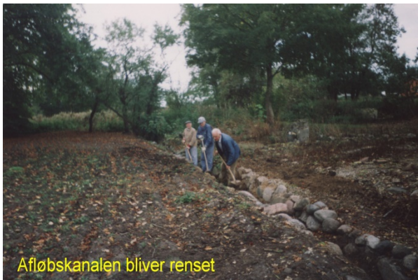
Afløbskanalen bliver renset