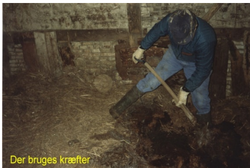
Der bruges kræfter

en 20. februar 1999 er kostalden tømt for møg, så der kan sættes ting, der ikke skal bort, derind.