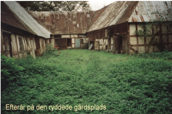
Efterår på den ryddede gårdsplads

For at få traktorerne transporteret måtte man bede Chresten Schmidt komme med sin truck.