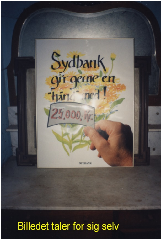
Billedet taler for sig selv

Kronborg meddelte også, at der skal være pressemøde her den 2.10.2002. kl. 14.