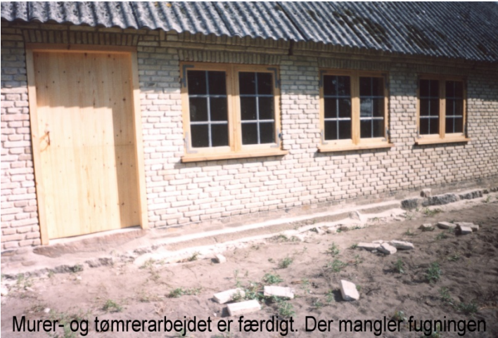
Murer- og tømrerarbejdet er færdigt. Der mangler fugningen

Da gruppen mødte på arbejde var der sat vinduer i sydmuren. Det er fine vinduer.