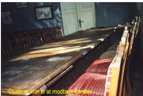
Stuen er klar til at modtage gæster

Fredag den 1. december 2000: Bordet, der var båret over fra det røde hus, havde fået bordduk på, og