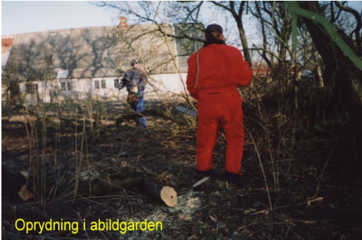
Oprydning i abildgården

Den 8. april var det fint arbejdsvejr. Der blev igen læsset et stort læs gammelt træ. Men ellers skulle der renses op til påske og sommersæsonen. Der blev brugt koste, skovle og trillebøre på den nordre "brogård" (gårdsplads).