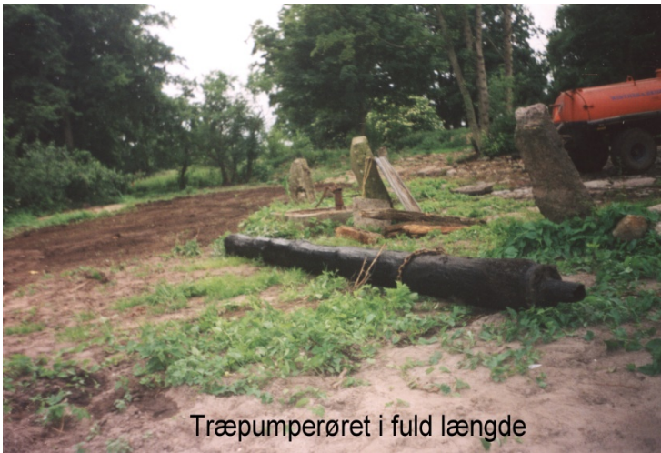
Træpumperøret i fuld længde

blev der trukket et gammelt træ pumperør (sugerør) der foreløbig blev lagt i skygge. Der fortsattes