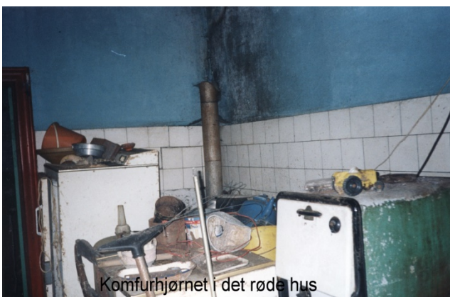
Kømfurhjørnet i det røde hus

23.03.02: Der var ikke mødt mange på arbejde, for der var forår i luften og landmændene var i