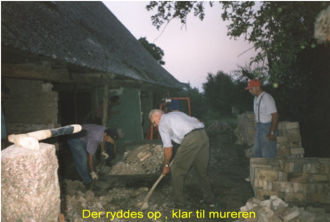
Der ryddes op, klar til mureren

Der har i årenes løb været andre, men dette er holdet sommeren 2002.