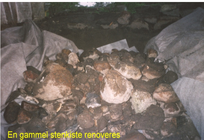
En gammel stenkiste renoveres

Den lokalhistoriske gruppe var på udflugt, kom sent hjem, men nåede dog at få lidt fra hånden på gården. Stenkisten blev færdig. Der blev også klinet og forskelligt. Den planerede jord var blevet harvet. Der var gæster.