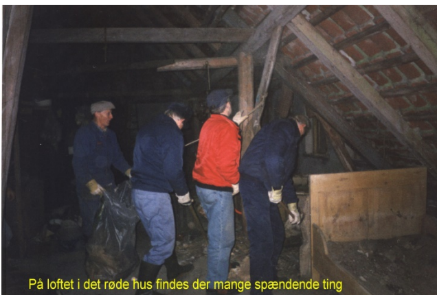
På loftet i det røde hus findes der mange spændende ting