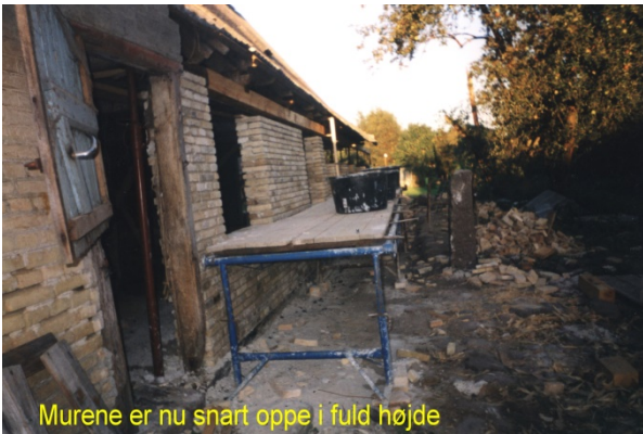
Murene er nu snart oppe i fuld højde

19.09.02: Mandskabet er igen i Himmark for at rense sten, så jeg var alene, men der kom et par gæster. Det var mørkt, inden de gik, og da jeg var ved at låse døren, kom folkene også fra Himmark, det bliver tidligt mørkt nu.