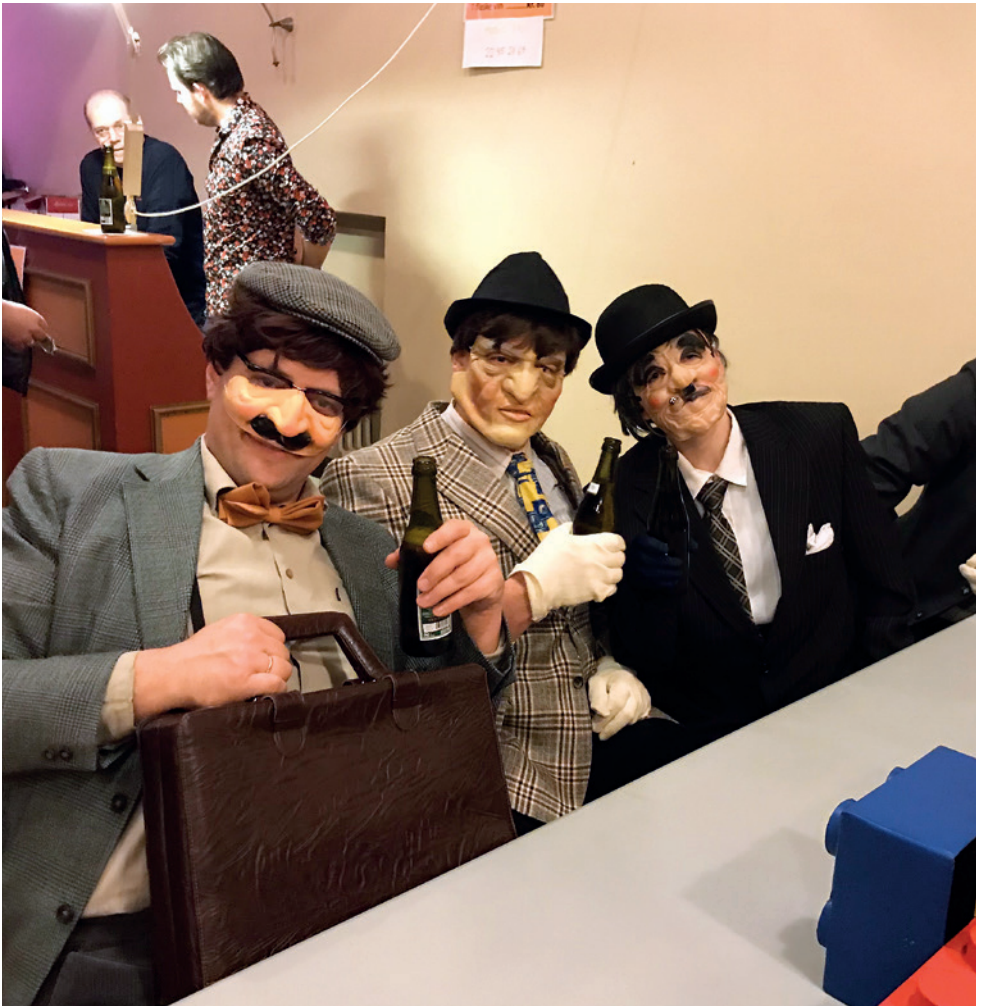
Olsenbanden på spil til Helligtrekonger 2019