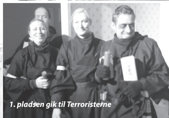
1. pladsen gik til Terroristerne