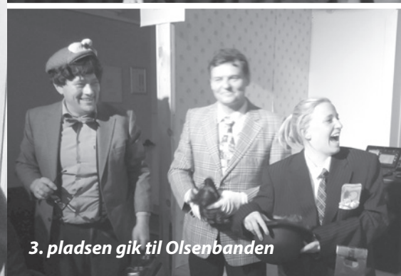
3. pladsen gik til Olsenbanden