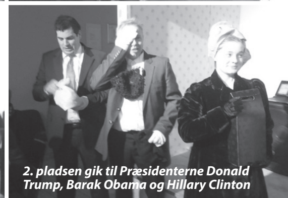
2. pladsen gik til Præsidenterne Donald Trump, Barak Obama og Hillary Clinton