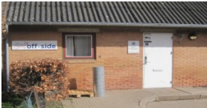
Generalforsamlingen afholdes her på 1' sal.