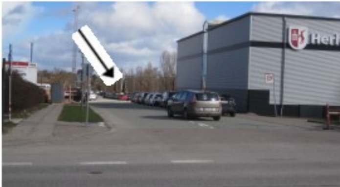
Her ligger HI 's lokaler off side - Tvedvangen 200