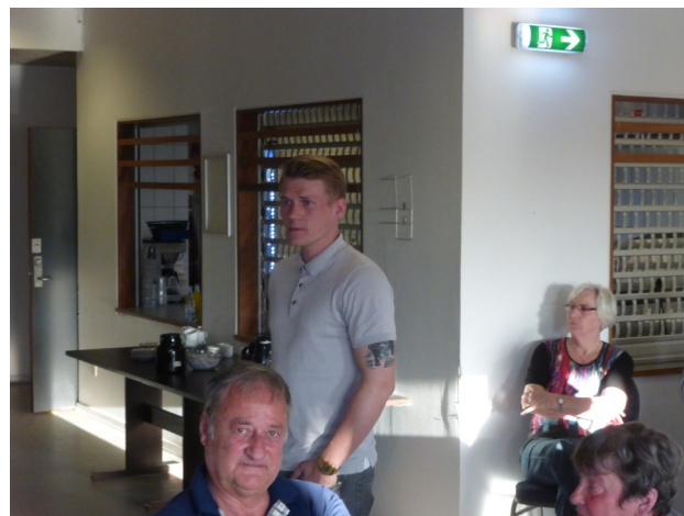
Vestegnens politi fortæller om forebyggelse af indbrud og om Nabohjælp.