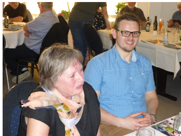
Vi fik alle nogle gode råd.